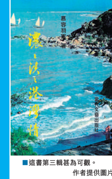
這書第三輯甚為可觀。

生於上世紀50年代的我，當年中學都是按學區劃分的，方圓也就在兩公里左右。內住家更近，僅800米之距，完全可以走路去上學。有什麼必要開着車去接送孩子呢？為了接送孩子風風光光，內弟還特意舉債買了輛小車。像內弟這樣為了接送孩子上學買小車的為數還不少。