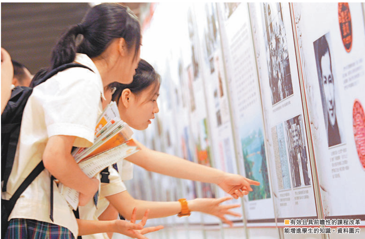
有效且具前瞻性的課程改革能增進學生的知識。資料圖片