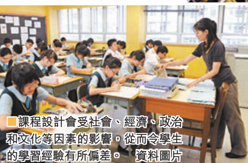
課程設計會受社會、經濟、政治和文化等因素的影響，從而令學生的學習經驗有所偏差。資料圖片