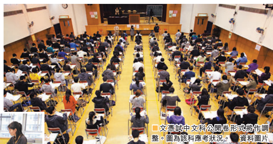
文憑試中文科公開卷形式將作調整。圖為該科應考狀況。資料圖片