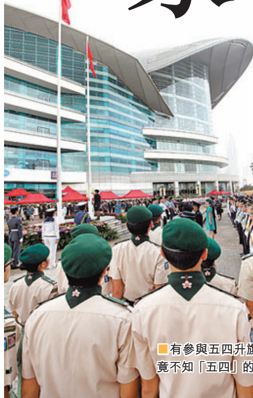
有參與五四升旗禮的中學生竟不知「五四」的真正意義。