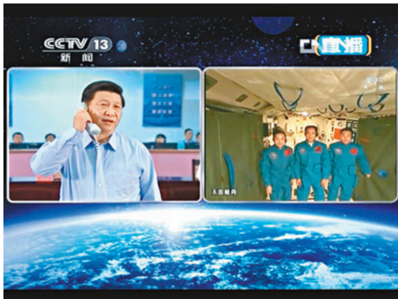
■昨日，習近平與正在「天宮一號」執行任務的三位航天员進行天地通話(視頻截圖)。