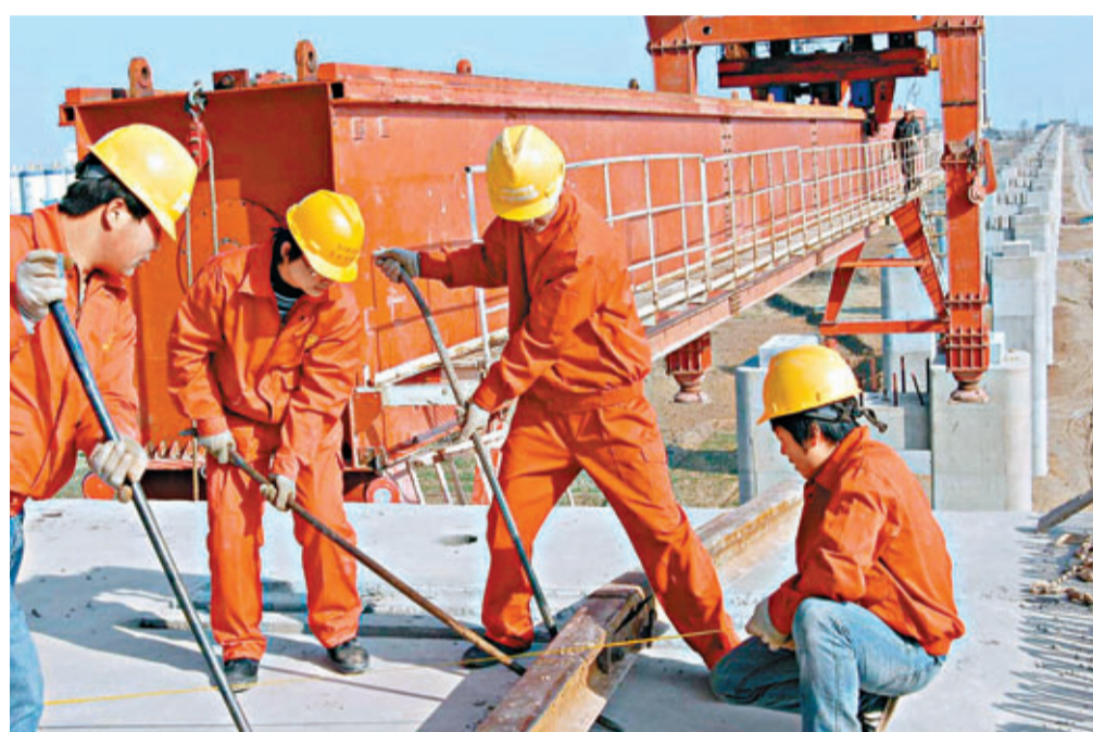
■審計顯示，原鐵道部不符合財經制度規定的問題金額15.7億元。圖為工人在施工。

原鐵道部為中央財政一級預算單位，部門預算由部本級和64個二級預算單位的預算組成。審計顯示，原鐵道部不符合財經制度規定的問題金額15.7億元；其中2012年15.5億元；其他財政收支方面不符合財經制度規定的問題金額8億元。