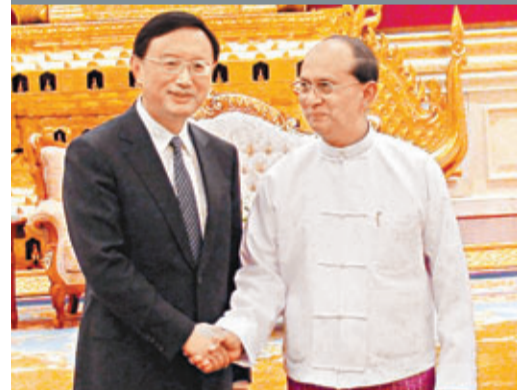
■楊潔篪與吳登盛(右)握手。

香港文匯報訊 據中國外交部網站消息，昨日，緬甸總統吳登盛在內比都會見中國國務委員楊潔篪時表示，在涉及中國重大核心利益問題上堅定支持中方。