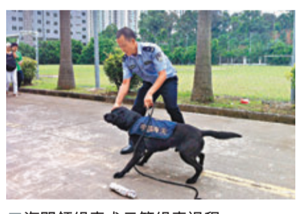
海關緝毒犬示範緝毒過程。

該次開放日活動，就是為充分展示海關打擊毒品走私的成果和堅定決心，更好地推動社會了解和支助海關禁毒工作，積極參與禁毒人民戰爭，更加有力地打擊毒品跨境走私活動，堅決拒毒品於國門之外。