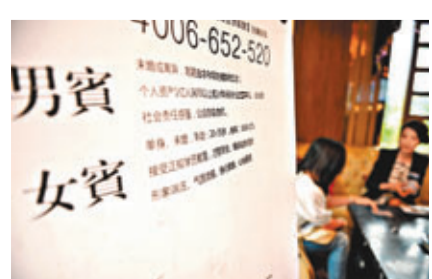
該單身俱樂部的入會條件。

昨日，由內地一企業家單身俱樂部主辦的單身派對入會面試在廣西南寧舉行，吸引多名單身妙齡女性參加。據主辦方介紹，加入該單身俱樂部的單身男性需擁有億元身家，每年繳納20萬年費，女性入會則免費，但在年齡、身高和學歷有所限制。單身女士入會將面臨面試、背景調查、形象包裝等三輪考驗。