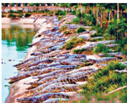
鱷魚池裡有百多條大大小小的鱷魚。

事發之後，茂名高州分界鎮及時展開調查、搜捕，並以各種方式通知附近村莊、學校，嚴加防範鱷魚傷人，