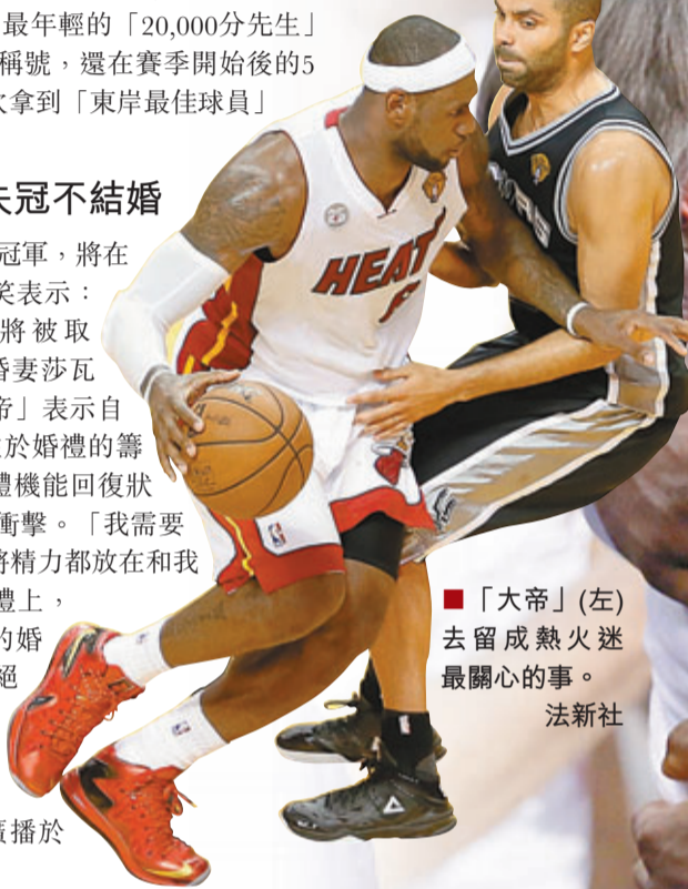
「大帝」(左)去留成熱火迷最關心的事。