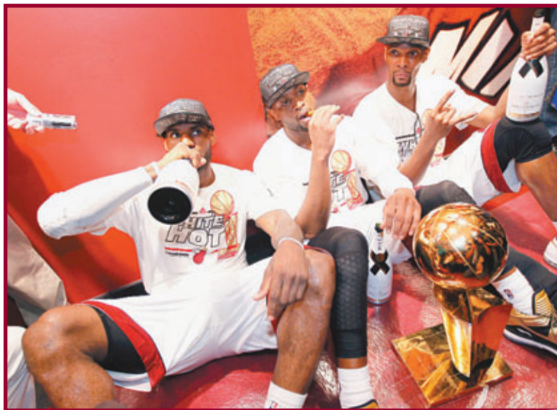
熱火球員在慶祝會上狂飲酒。