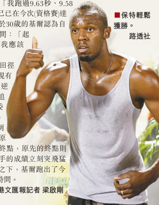
保特輕鬆獲勝。