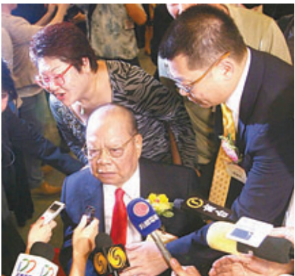
■曾憲梓昨日在出席一公開活動後接受訪問。旁為其子曾智明。

香港文匯報訊（記者 鄭治祖）反對派鼓吹「佔領中環」，近日更聲言會於今年7月1日遊行時「預演」。原全國人大常委曾憲梓昨日表明，強烈反對「佔領中環」，並批評「佔中」旨為衝擊「一國兩制」，破壞中央政府管治下的香港特別行政區，破壞香港的繁榮穩