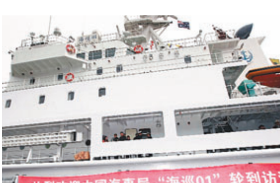
中國海事旗艦船「海巡01」輪22日上午抵達澳大利亞悉尼花園島海軍基地。

香港文匯報訊（記者 劉凝哲 北京報道）在創造連續4天的下潛紀錄後，中國「蛟龍」號載人潛水器於21日抵達廈門錨地避風，並開始全面檢修。