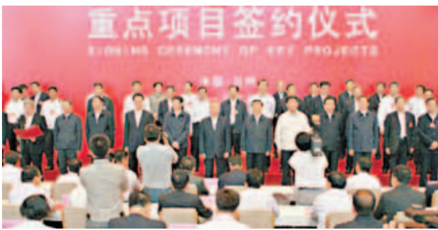
55個重點項目在蘭州洽談會開幕式後集中簽約。香港文匯報記者肖剛攝

甘肅省省長劉偉平表示,第十九屆中國蘭洽會以「承接產業轉移、發展循環經濟、促進轉型跨越」為主題,圍繞循環經濟示範省、蘭州新區、華夏文明傳承創新區建設,以及新能源基地、有色冶金新材料基地、特色農產品生產與加工基地建設,搶抓產業加速向西部轉移的機遇,充分利用國內外「兩種資源、兩個市場」,開展國際間、省際間、區域間的經濟交流與合作,推進科學發展、轉型跨越、民族團結,富民興隴。商務部副部長王超說,甘肅資源富