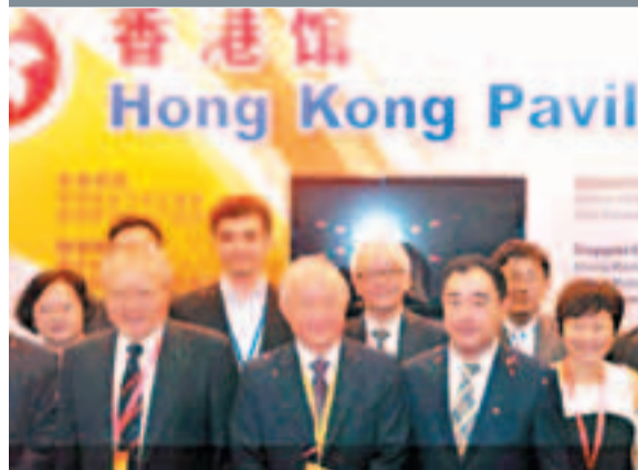
商務部原副部長劉向東(前排左一)、香港政府諮詢科技總監賴錫璋(前排左二)、大連市副市長曲曉飛(前排左三)參加香港館開館儀式。

香港文匯報訊(記者 齊曉玫、毛絮薇 大連報導)第十一屆中國國際軟件與信息服務交易會周四在大連開幕。作為目前國內最有影響力的IT行業年度盛會及國際軟件和信息服務交易平台,吸引了來自海內外參展商800多家,預計參觀觀眾3萬多人。在軟交會入口