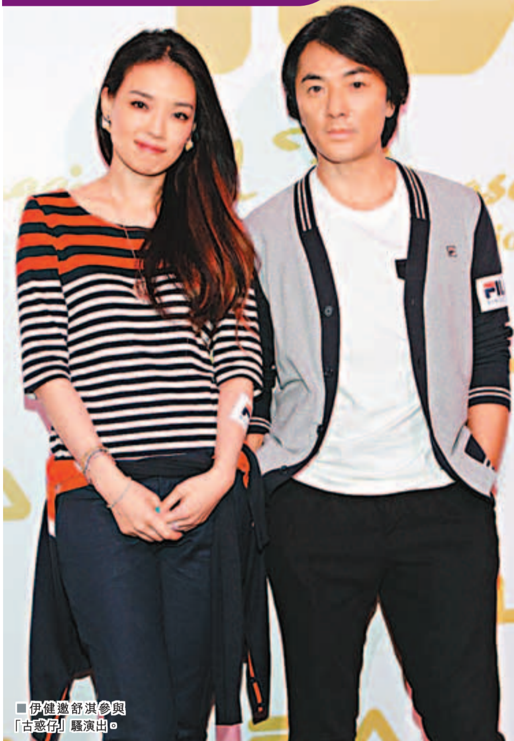
伊健邀舒淇參與「古惑仔」騷演出。