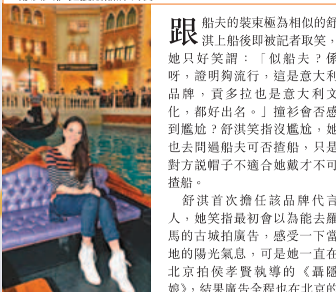
舒淇乘坐貢多拉到會場。

空去過美國洛杉磯玩了一星期，享受加州陽光歸來，再到蒙古繼續拍戲「享受」陽光。舒淇今日便要飛山西繼續拍《聶隱娘》，她表示拍攝最受罪是其「屁股」，因該處外景是偏僻之地，車程往往花6、7小時才抵達，她又未知何時才能拍完，真不想會是另一部《一代宗師》拍足幾年。而她又另接了一部新戲，可能會先拍新接的戲再繼續拍《聶隱娘》。