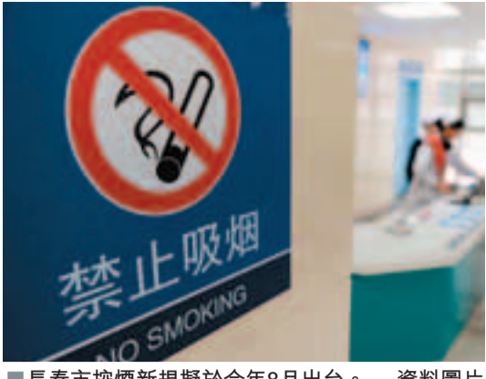
長春市控煙新規範將於今年8月出台。 資料圖片