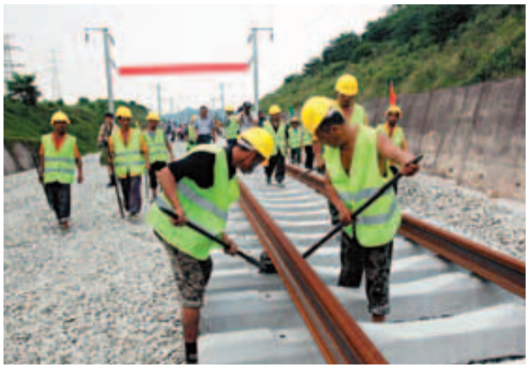
廈深鐵路惠深段長軌鋪設於本月20日正式開始,預計40天即將於7月底可完成鋪軌。

香港文匯報訊(記者 郭若溪 深圳報導)廈深鐵路惠深段長軌鋪設於本月20日正式開始,預計40天即將於7月底可完成鋪軌,並於8月進入聯調聯試階段。據了解,廈深鐵路建成通車後,深圳和廈門之間僅需3小時,將廈門、汕頭、深圳三大經濟特區連成一片,讓珠江三角洲地區與海峽西岸經濟區成功對接。