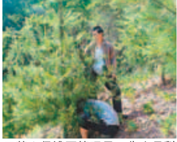
藥山保護區管理局工作人員對樹作GPS定位。

香港文匯報訊(記者 馮熾、通訊員 吳明忠 昆明報導)近日,雲南藥山國家級自然保護區管理局對人工採種育苗移栽種植在保護區楊家灣管理站樟木箐、小尖山等地塊的雲南五針松進行GPS坐標定位,測量其根莖大小、樹高,查看每株生長及周圍植被情況。結果顯示:2004年第一批育苗移栽的1694株雲南五針松生長良好,最大的根莖10厘米,樹高4.5米,目前已有20多棵已掛果。雲南五針松目前野生個體僅35株,樹齡10至50年,按照國際自然與自然保護聯盟1994年通過的瀕危物種劃分等級,五針松屬於「極危(CR)」物種,也是全球100種最瀕危物種。近年來,藥山管理局把雲南五針松的保護研究作為工作重點,通過實施雲南五針松救護與繁育項目對其進行了有效的選地保護,擴大了種群數量,使被列為全球最瀕危的這一物種得到了擴繁保護。