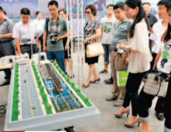
河南 節能環保 20日,河南省「新能源、新技術、新產品」節能成果宣傳展示活動在鄭州舉行,來自河南省內外的近百家新能源產品生產企業和科技研發單位現場展示新技術和新產品,宣傳節能理念,推動節能服務產業發展。

香港文匯報訊(記者 王尚勇、實習記者 閻靜茹 銀川報導)日前,寧夏回族自治區中衛市第三人民醫院與寧夏啟元大藥房醫藥有限公司簽訂協議,將醫院的西藥房交由啟元大藥房醫藥公司「全面托管」。這是寧夏第一家推行「藥房托管」的醫療機構。「藥房托管」堅持「三不變」原則:資產歸屬不變、醫院功能不變、職工待遇不變。按照「誰投資誰受益」的原則,托管期間除原有資產保值外,托管企業新投資形成的設備、設施等財產,一律歸托管企業所有。