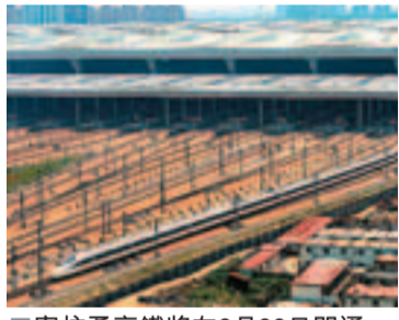
寧杭甬高鐵路將在6月30日開通。 新華社

香港文匯報訊(記者 潘恆 杭州報導)記者獲悉,寧杭甬高鐵路將於6月30日開通,7月1日高鐵路實行新版運行圖。杭州東至寧波東每天將一共開行列車74趟,18趟D字頭動車在寧杭、杭甬和滬杭高鐵路線上運行時將提速至250公里。從記者拿到的一份運行圖來看,杭州東至寧波東每天一共開行列車74趟,其中包括45趟高鐵路列車以及兩趟杭甬直達車。運營時間從早上6時一直持續到晚上9時。該份運行圖明確,寧杭、杭甬高鐵路開通後,G字頭高鐵路將按時速300公里運行,D字頭動車仍按時速200公里運行。不過在運行圖上,在滬杭、寧杭、杭甬高鐵路區間開行的18趟D字頭動車,將按時速250公里標尺執行。