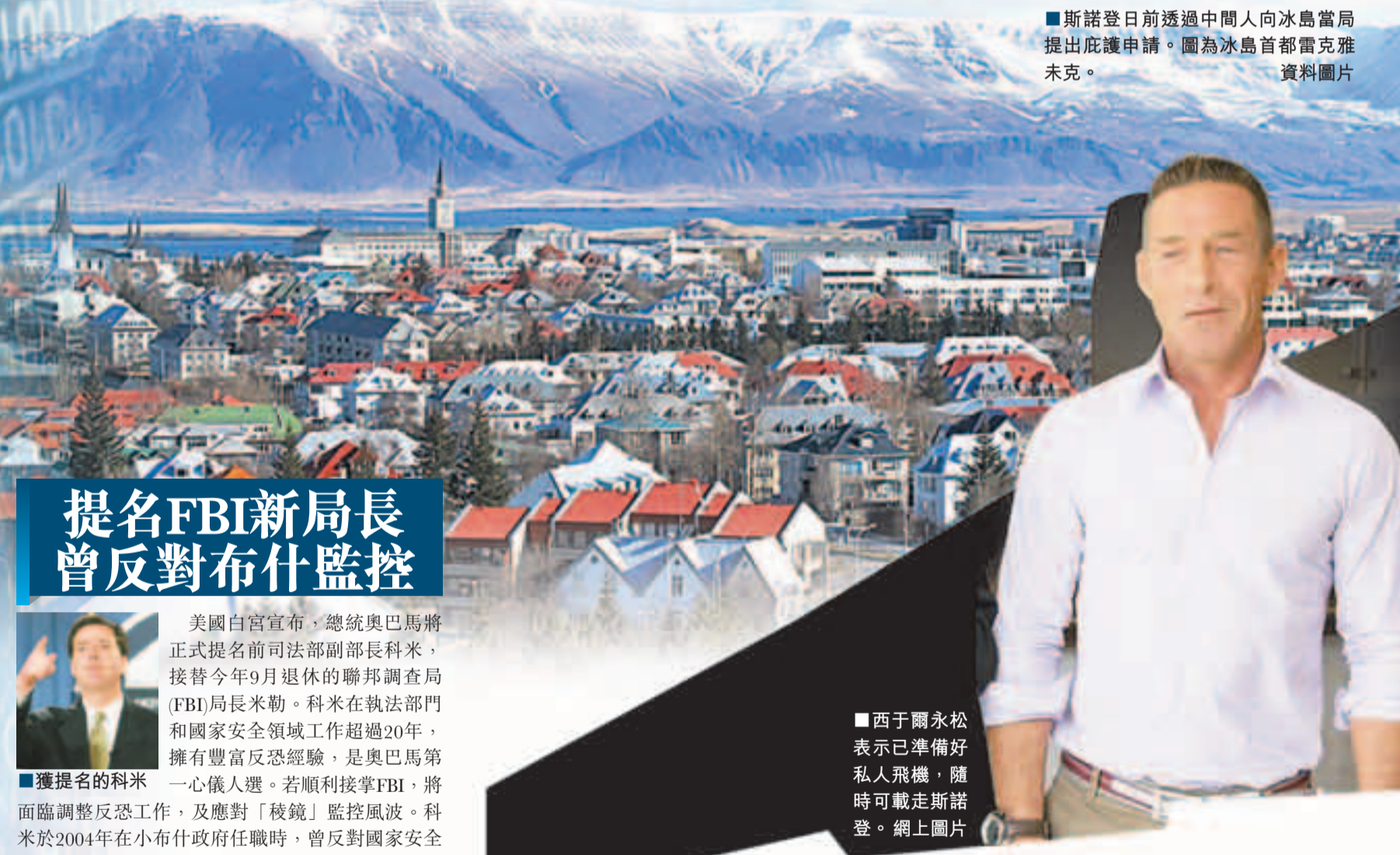
■斯諾登日前透過中間人向冰島當局提出庇護申請。圖為冰島首都雷克雅未克。資料圖片

合香港法律或不公平的處理」。袁國強指出，明白香港社會和傳媒對此事非常關心，「在這件事或其他移交申請，特區政府都是用一貫的合法、公平方法去處理」。當被追問美國是否已經提出移交斯諾登的要求時，他則沒有回應。