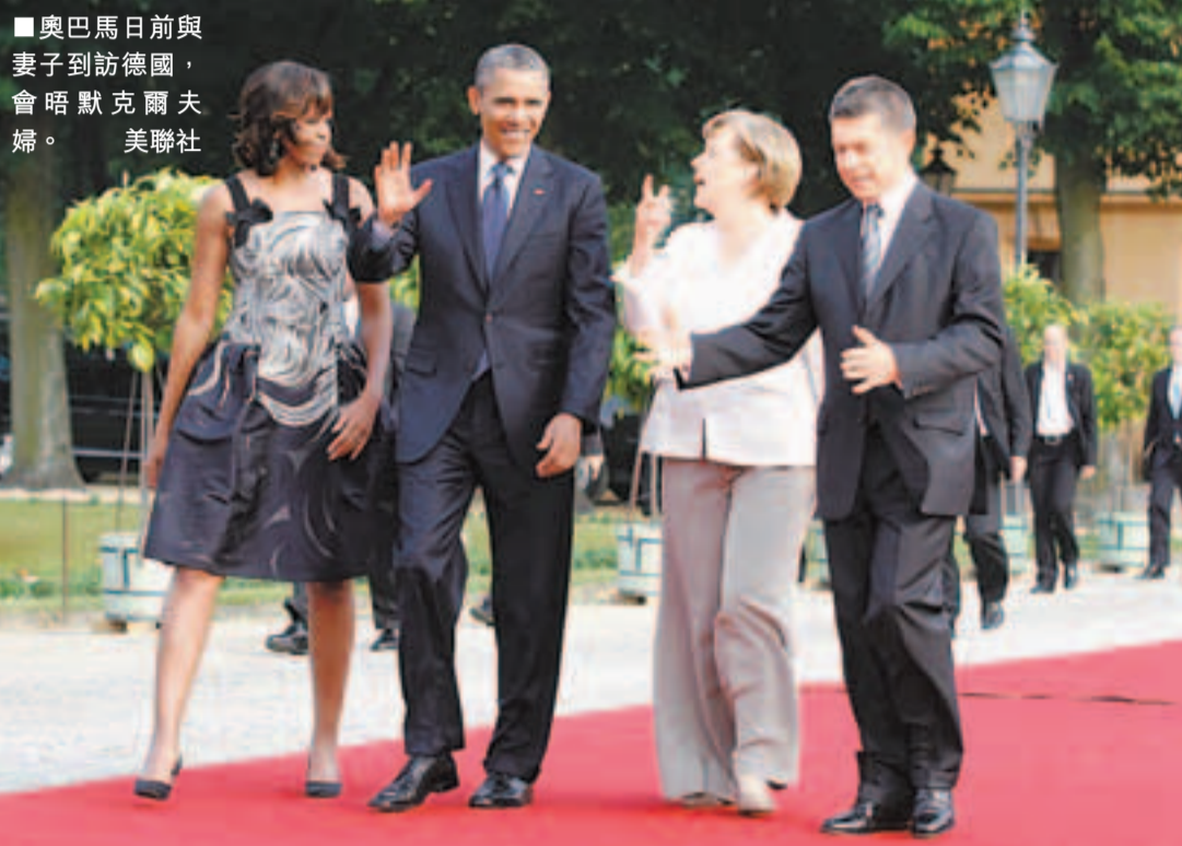
■奧巴馬日前與妻子到訪德國，會晤默克爾夫婦。