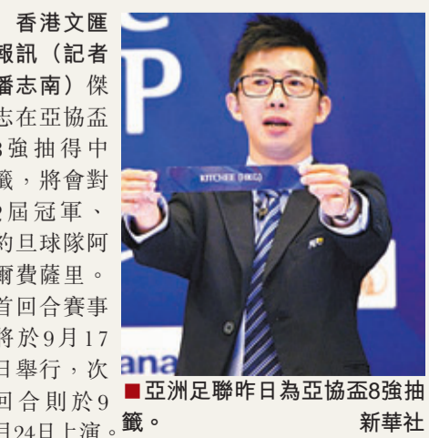
香港文匯報訊(記者 潘志南)傑志在亞協盃8強抽得中籤,將會對2屆冠軍、約旦球隊阿爾費薩里。首回合賽事將於9月17日舉行,次回合則於9月24日上演。

西亞球隊時,對方對傑志的小組入滲踢法有些不適應,而且西亞球隊的共通點是攻強守弱,故傑志的踢法是有利的,有機會晉級,加上當地天氣乾燥,踢波夜對香港球員有着數。記憶中當地很多軍警,而且比賽球隊均有軍警開路,十分安全。」傑志總監伍健也認同對西亞球隊是有機會,他表示目前要做的就是早點去收集敵方情報,以及晉級後遇到的對手比賽情況。