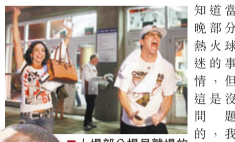
上場部分提早離場的熱火球迷一度要求重返球場遭拒。

知道當晚部分熱火球迷的事情,但這是沒問題的,我歡迎他們回來。(第7戰)就多待一點,與我們緊貼在一起吧。」