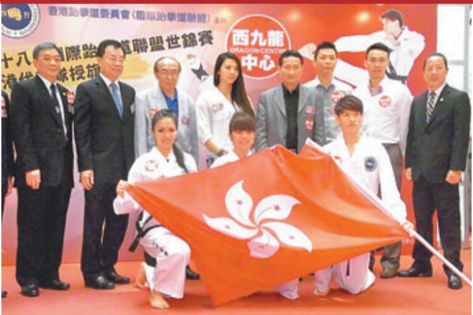
港跆拳道隊獲授旗出征世錦賽。

香港文匯報訊(記者 潘志南)香港跆拳道委員會昨宣布派出2女1男的代表隊,參加7月在保加利亞舉行的第18屆國際跆拳道聯盟世錦賽,與來自近70個國家和地區的參賽選手較量,目標是登上頒獎台。