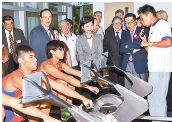
政務司司長林鄭月娥(中)參觀賽艇中心訓練設施。