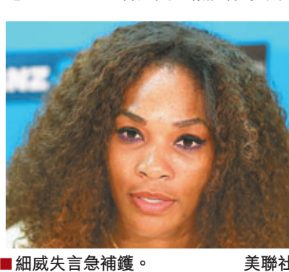
細威失言急補鑊。

細威這番言論惹來外界猛烈抨擊,令她在周三立即發表聲明道歉說:「在斯托本維爾鎮發生的案件真的令我感到震驚,為此我深感難過。對一名只得16歲的少女來說是可怕的慘劇,我已與受害少女家人接觸,表達歉意。」