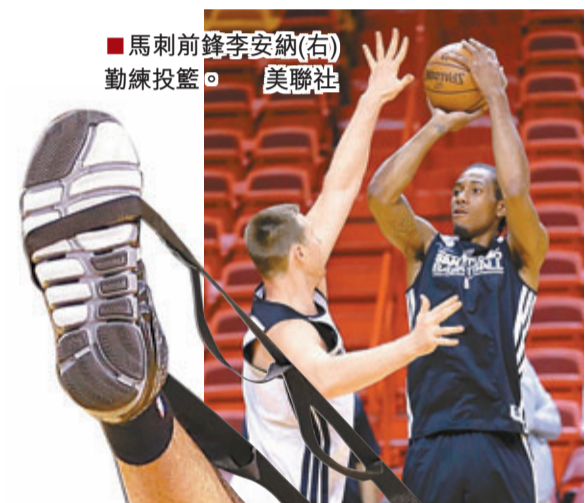
馬刺前鋒李安納(右)勤練投籃。