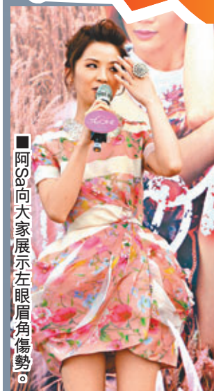
阿Sa向大家展示左眼角受傷勢。