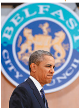
面對監控網絡醜聞，奧巴馬「頭痛」不已。

針對是次事件，國家外交部發言人指出，目前並無斯諾登相關資料，並指出中國是最大的駭客攻擊受害國之一。歐盟司法專員則已致函美國司法部長，查問歐洲人是否成為美國監控目標、歐洲人如何查閱其個人資訊是否被蒐集等。德國總理默克爾表明，會向即將訪問柏林的美國總統奧巴馬直接查問。英國政府則向全球航空公司發出警報，促請它們不要讓斯諾登登機赴英，否則將被罰款2,000英鎊，並會被要求承擔相關衍生開支。