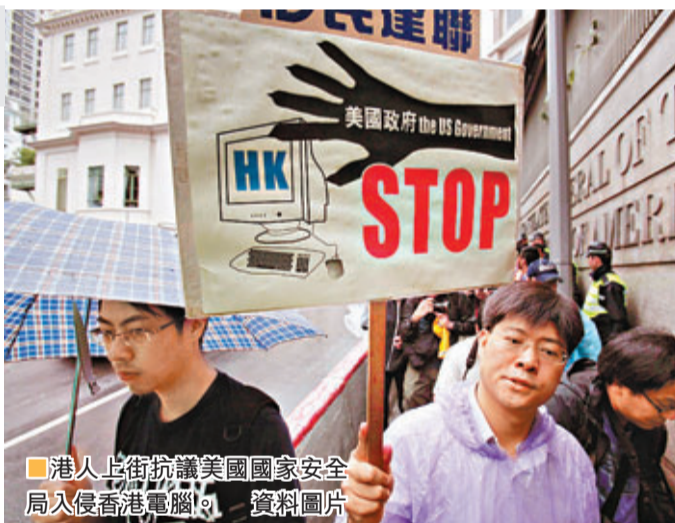
港人上街抗議美國國家安全局入侵香港電腦。資料圖片

尖沙咀美麗華酒店證實，曾有一名叫「愛德華·斯諾登」的住客入住，但已退房。截稿前，斯諾登仍不知所終，但普遍相信仍在香港境內。根據《入境條例》，美國公民可在香港逗留90日。斯諾登理應會在8月18日或以前處理在港去留問題。