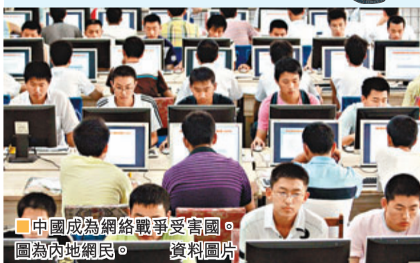
中國成為網絡戰爭受害國。圖為內地網民。