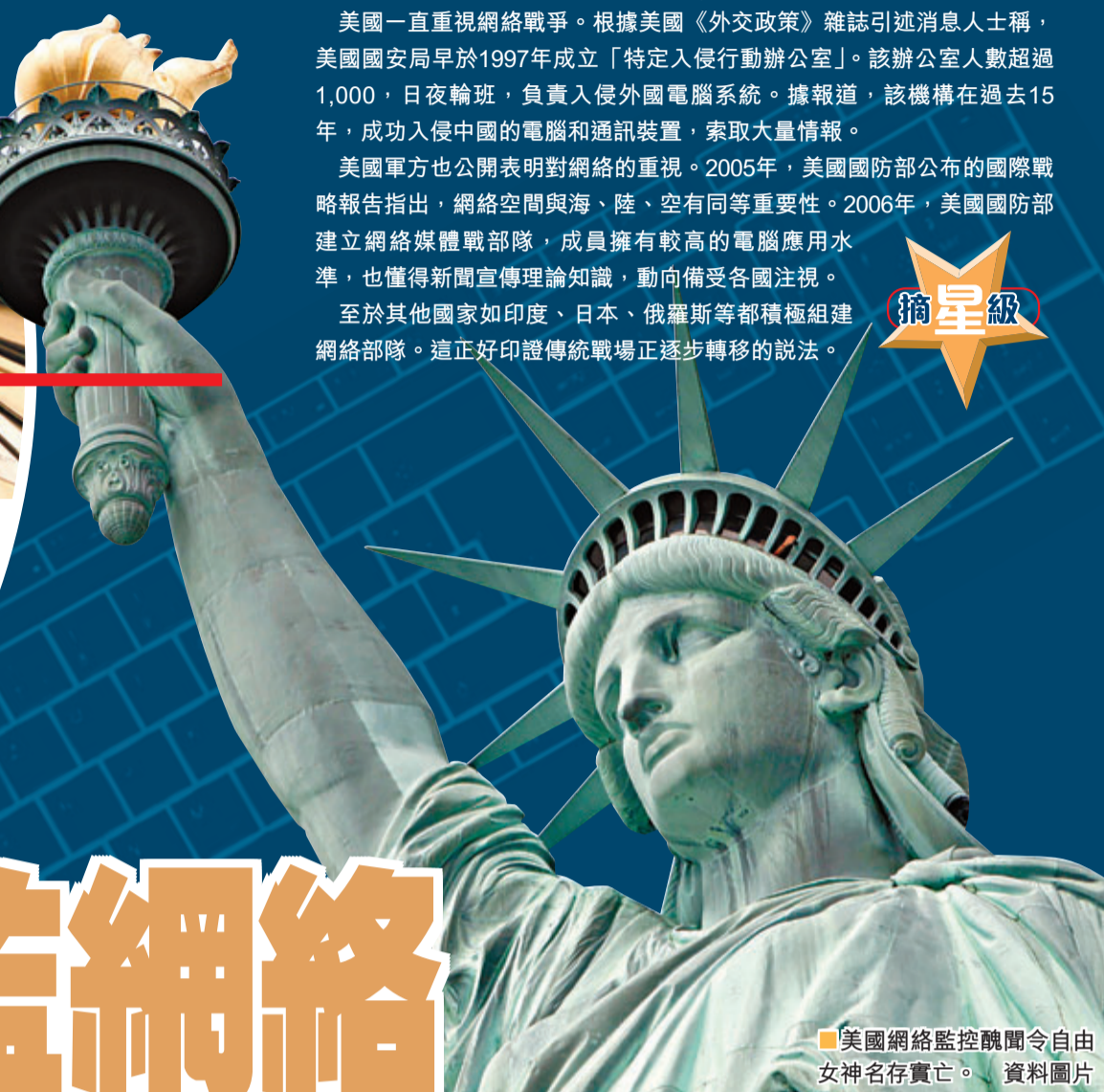
美國網絡監控醜聞令自由女神名存實亡。