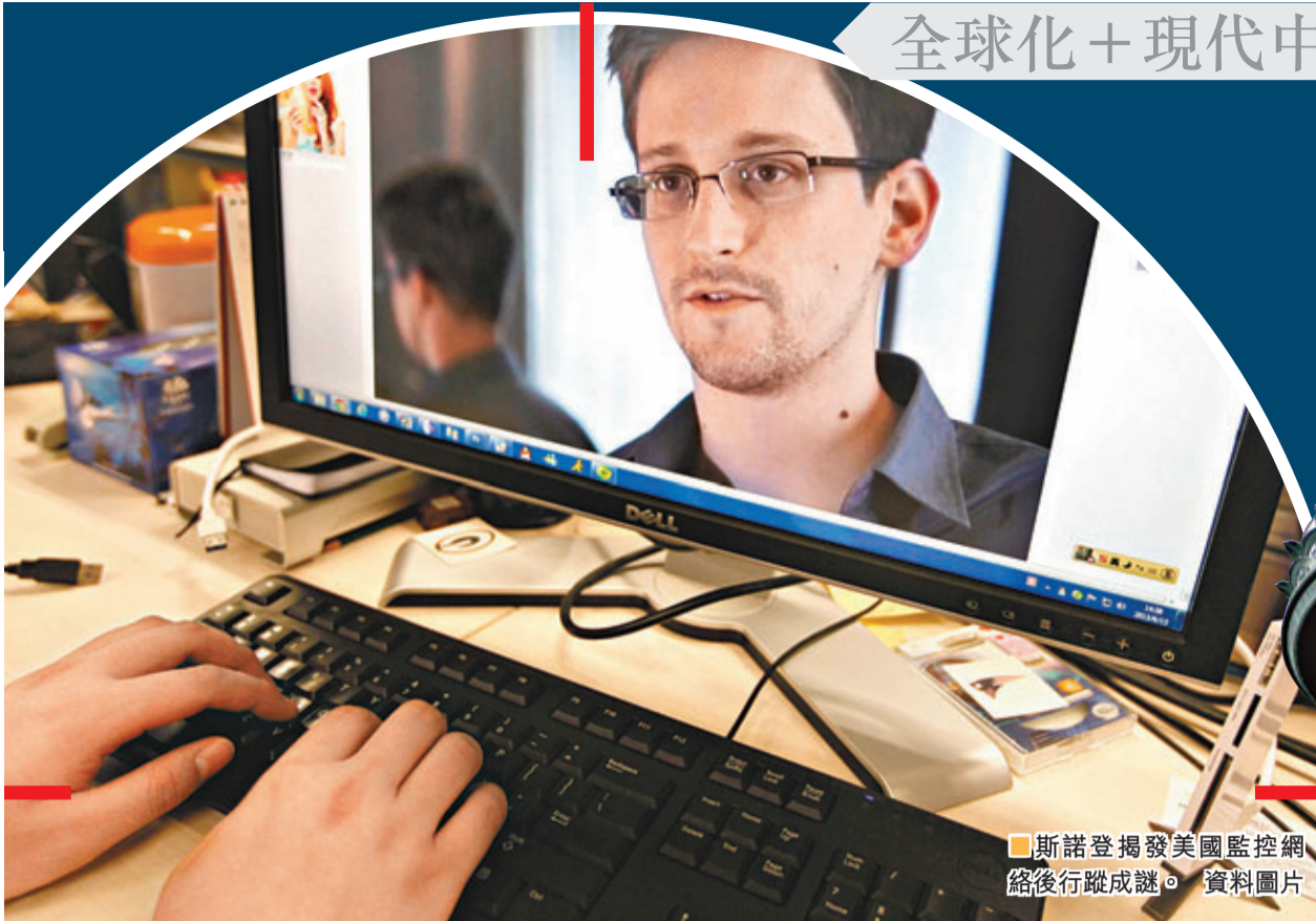
斯諾登揭發美國監控網絡後行蹤成謎。資料圖片