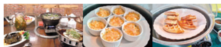
大家可品嚐花香美食 迷你海鮮飯 鬆餅