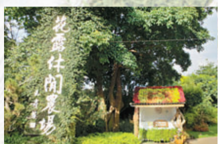
苗栗花露休閒農場門口