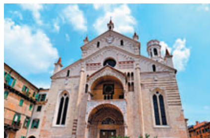
意大利維羅納大教堂