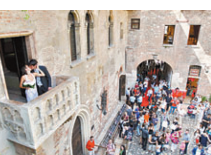
意大利維羅納街景