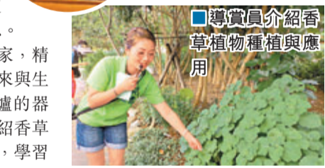
導覽員介紹香草植物種植與應用