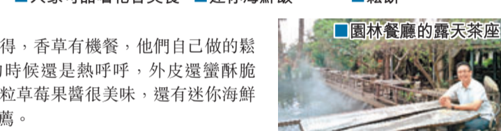
園林餐廳的露天茶座