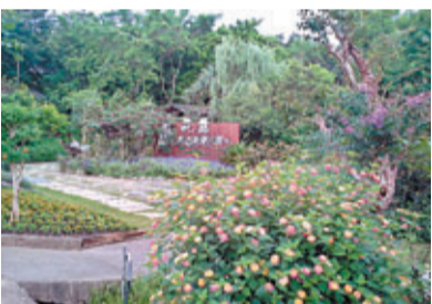
香草植物區：觸動五官，香草植物的體驗。

花露農場擁有各式花卉盆栽、藥用香草植物，走進園區就有專人引導你體驗芳香的能量，用薰衣草、迷迭香、老鼠草等香草植物觸動客人五官的體驗，在香草植物區，讓遊客親眼看看自己用的香水精油是來自哪種植物的，知道香草植物種植與應用常識，挺有意思。「花卉區」內有麗格海棠、仙客來、蘭花，從每盆十元的香草植物系列到高價位的松柏均有。「仙人掌區」種植了各式的耐旱植物，最有名的莫過於仙人掌，植株色彩多樣。特殊果樹園區，由全球各地搜羅近40種食藥植物，像豬籠草、太陽瓶草等等，品種之多堪稱台灣之最，可供教學服務。