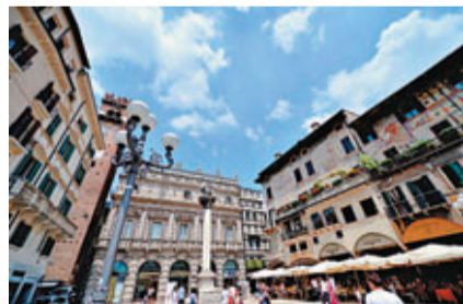
意大利維羅納香草廣場