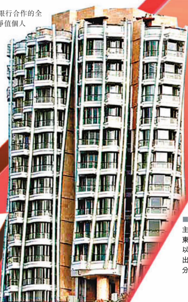
■房地產是富裕人士主要投資資產之一。東半山豪宅做去年以呎價六萬八千元售出高層戶，打破亞洲分層單位紀錄。

由凱捷及加拿大皇家銀行合作的全球財富報告用於追蹤高淨值個人及其財富，今年是全球財富報告推出的第17年。今年的報告以分布於21個國家（地區）共4,400多名富裕人士的回應為基礎，探討富裕人士的信心水平、資產配置決定，以及富裕人士對財富管理建議與服務的偏好。