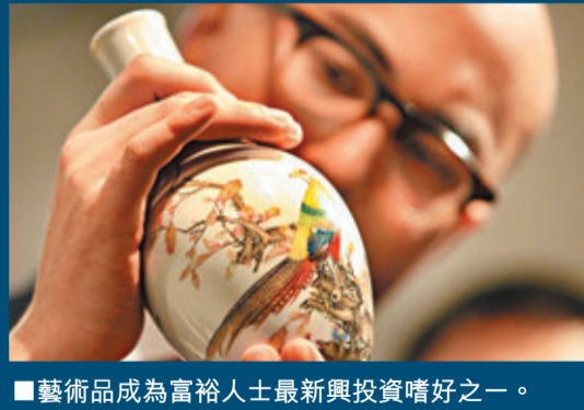
■藝術品成為富裕人士最新興投資嗜好之一。