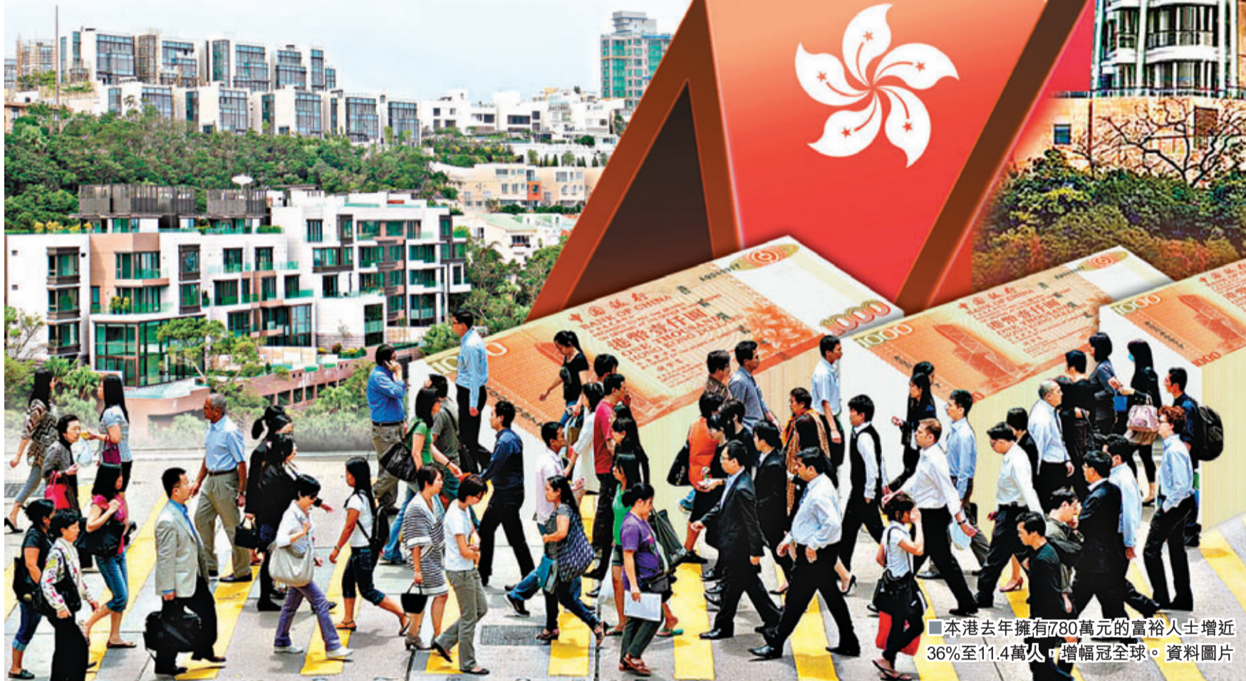
■本港去年擁有780萬元的富裕人士增近36%至11.4萬人，增幅冠全球。資料圖片