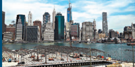
■去年北美富裕人士達373萬名，高於亞太區的368萬名。