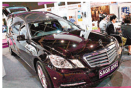
■仁智國際集團今年訂製了運送遺體的紫色Benz。

相信每個人的心中都有一間Dream House，雖然在人生在世未必實現得到，但台商天章紙紮(skea)主營高檔精緻紙紮品，就可以讓客人生前預訂心目中的紙