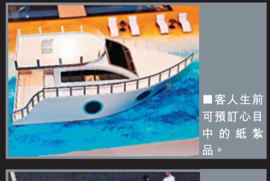
■客人生前可預訂心目中的紙紮品。

在中國傳統中，很多人都覺得如果子女在父母生前，問父母有關死後的問題，父母都會覺得「你是希望我早點死嗎？」中華殯葬教育學會理事長尉滄澣指，「很多人都有這個想法，但天知道你想你的葬禮要用什麼形式。你要什麼佈置，喜歡用什麼花，如果你不說，誰知道呢？難道走到人生最後一程了，你都沒有要求嗎？」他認為殯葬業是要協助死者死得似一個人，成全他最後心願，個人認為這件事要比婚禮更重要，因此推出更人性化的服務將會是這個行業的趨勢。