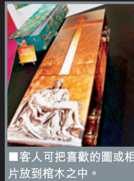
■客人可把喜歡的圖或相片放到棺木之中。