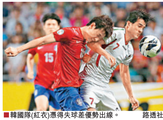
韓國隊(紅衣)憑得失球差優勢出線。