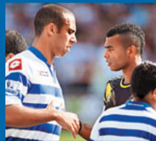
A高(右)與安東仇人見面，分外眼紅。

2011年10月，車仔隊長泰利被昆士柏流浪後衛安東指在比賽中對他種族歧視。後來法庭審理判泰利無罪，他的車