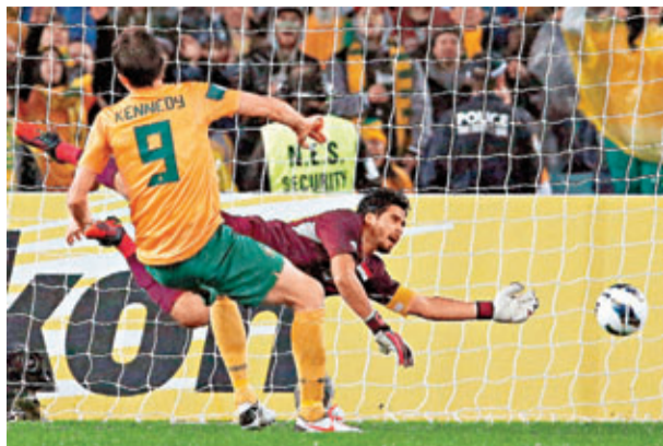
澳洲隊憑藉祖舒堅尼地(左)的入球奠勝。

澳洲隊連續3屆世界盃取得決賽周32強席位，韓國隊則僅憑藉得失球差優勢，在有驚無險下出線，連續第8次亮相這項國際頂級足球大賽。