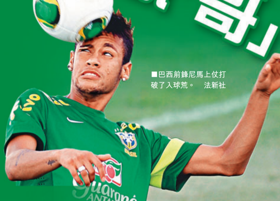
巴西前鋒尼馬上仗打破了入球荒。