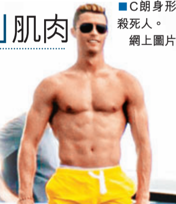
C朗身形殺死人。網上圖片

正在美國邁阿密海邊度假的C·朗享受陽光與海水，而英國傳媒就驚歎這位葡萄牙足球巨星似乎變得「大隻」了。C朗與幾個朋友一起在遊艇上曬太陽，起身時健碩的肌肉被記者拍到。英國《每日郵報》對比說，18歲的C朗還是一副瘦弱的身材，2004年在曼聯時肌肉雛形漸現，但皮膚煞白。到如今28歲的C朗，胸部和雙臂肌肉，都儼然一副超人的模樣。