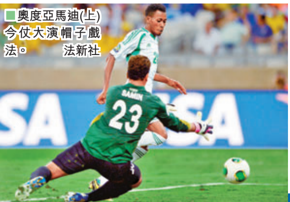
奧德亞馬迪(上)今仗大演帽子戲法。