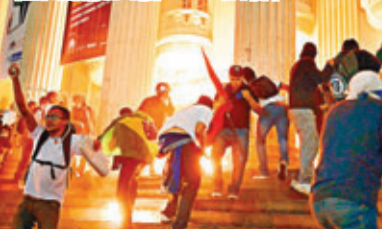
示威者闖進了里約熱內盧州議院大樓。

據外電報道，各城市參加抗議活動的總人數超過20萬，是10天前抗議活動開始以來規模最大的一次。儘管整體上抗議方式比較平和，但在里約州議院附近，為了驅散小部分破壞公共財物的蒙面青年，警方動用了催淚彈、胡椒噴霧和橡膠子彈。有些年輕人闖入了大樓，電視畫面還顯示有地方起火。據報，有5名警察在衝突中受傷，另約80名警察退至大樓內，樓外聚集了大量示威者。據警方的數據，在里約大約有10萬人參加了遊行。在巴西利亞，200多名年輕人短暫佔據了國會大廈的房頂。經和警方談判後，人群最終同意撤離。在聖保羅也有約6.5萬人參加了和平示威。