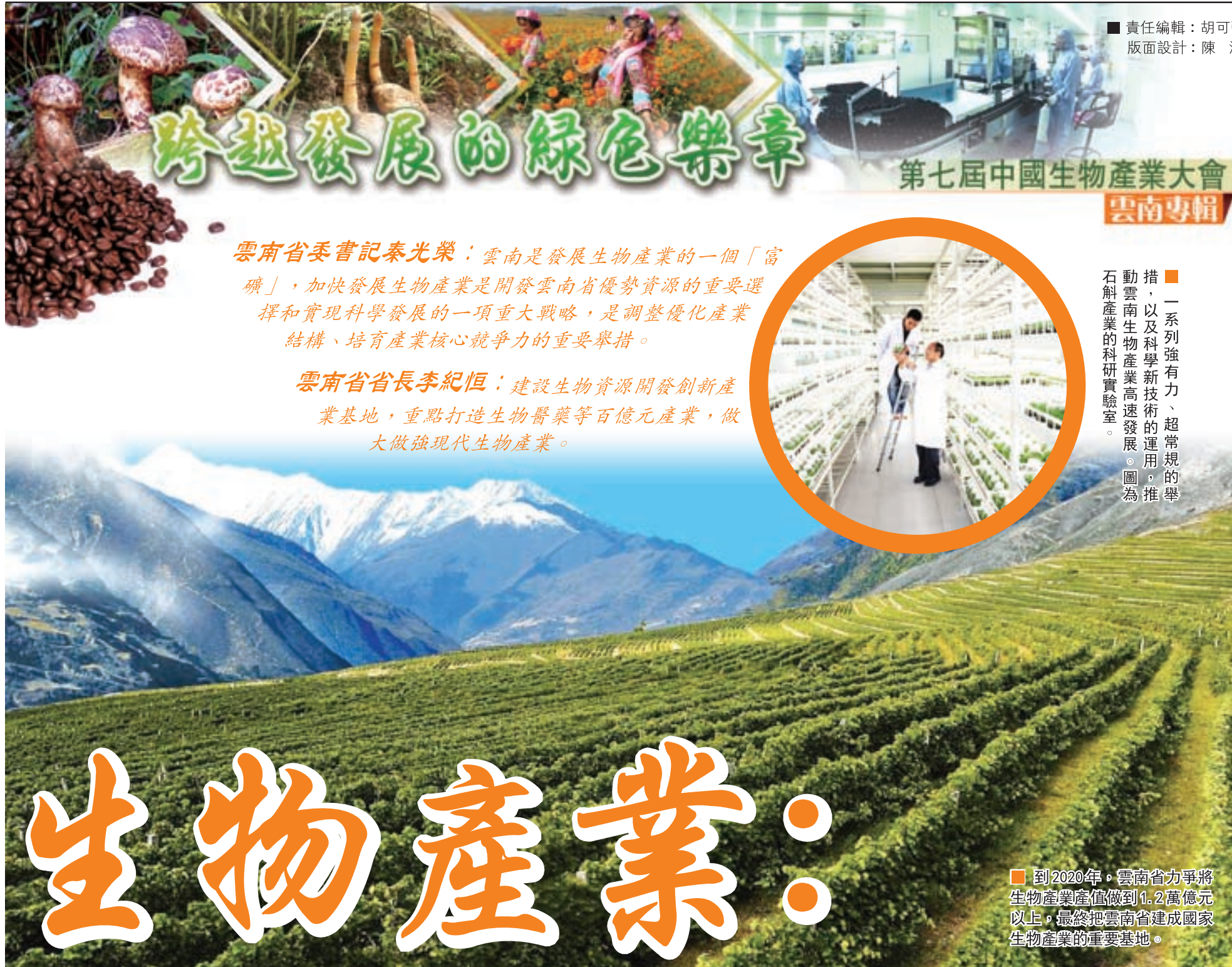
■責任編輯：胡可強 版面設計：陳潔