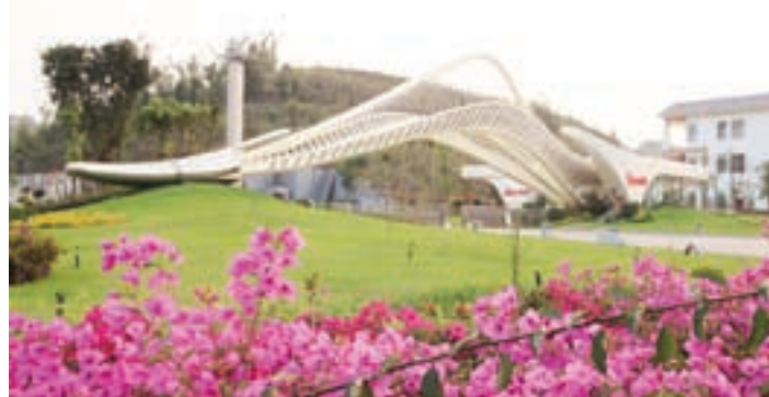
■2012年12月，天士力帝泊洱生物茶集團產業基地正式投產，給雲南茶產業帶來了新的變革。

彩雲之南，物華天寶，有「植物王國」、「動物王國」的美譽。這裡分佈着中國60%的高等植物、59%的脊椎動物、70%的中藥材、60%以上的微生物；中國頂級生物科研機構和人才雲集這裡；三七、天麻、茶葉等特色產品享譽全球，天士力帝泊洱、雲南白藥、光明石斛等知名品牌從這裡走向世界。 優勢資源的科學開發，推動了雲南生物產業的快速發展，成為雲南新跨越的強勁動力。 ■香港文匯報記者 李守清、芮田甜 昆明報道