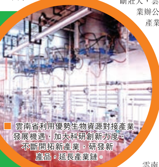
■雲南省利用優勢生物資源對接產業發展機遇，加大科研創新力度，不斷開拓新產業，研發新產品，延長產業鏈。

近年來，隨着保健品市場的不斷擴大，藏在深閨的雲南石斛迅速成為新寵，眾多內地知名大型企業紛紛入駐，各地石斛種植遍地開花，10個州市的37個縣開始大規模人工種植，產業呈現出可喜的迅猛發展趨勢。2012年，雲南石斛種植面積已達6萬餘畝，佔全國種植面積的一半以上；全年石斛鮮條產量約5000噸、產值達30億元。