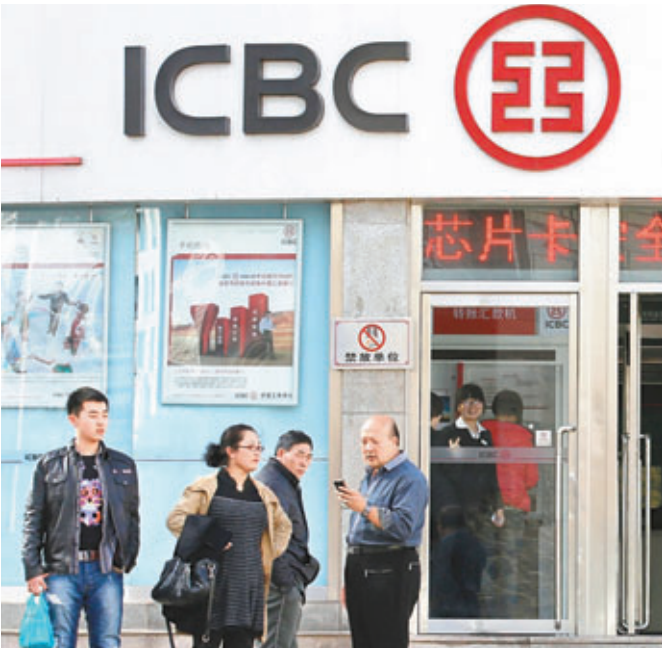
■中央匯金上周四(13日)增持工行A股1,932萬股，使匯金在工行總股本升至35.4647%。圖為工行位於北京的分行。

另外，受匯金增持利好提振，周一滬深兩市微幅高開，但大盤權重下挫，股指高開低走，全天維持弱勢