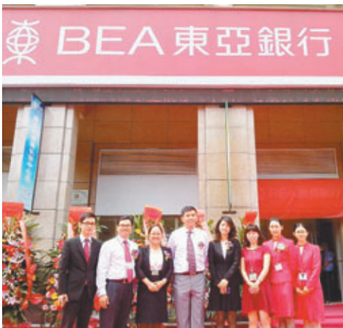
■圖為東亞深圳長安異地支行開業。