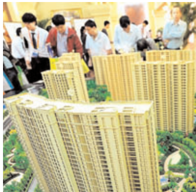
■2012年粵納稅百強排行榜，進榜房企較上年增加。

香港文匯報訊（記者 古寧 廣州報道）廣東日前最新公佈了2012年度廣東納稅百強排行榜，對比2011年度榜單，雖然政府調控房地產市場的力度不斷加大，上榜2012年度廣東納稅百強的房地產開發經營企業數量仍有增無減。2012年度上榜房企不僅數量