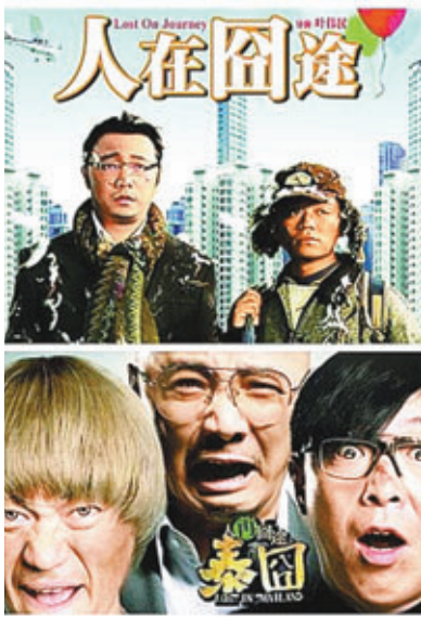
《泰囧》內地勁收逾12億元票房。