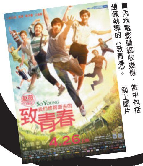
內地電影動輒收幾億，當中包括趙薇執導的《致青春》。網上圖片