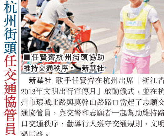
■任賢齊杭州街頭協助維持交通秩序。

新華社 歌手任賢齊在杭州出席「浙江省2013年文明出行宣傳月」啟動儀式，並在杭州市環城北路與莫幹山路路口當起了志願交通協管員，與交警和志願者一起幫助維持路口交通秩序，勸導行人遵守交通規則，文明過馬路。