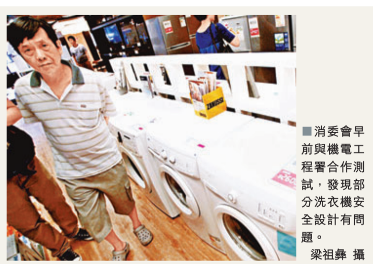
消委會早前與機電工程署合作測試，發現部分洗衣機安全設計有問題。