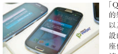
只要將支援「Qi」的裝置放於充電器上就可以充電。

由於產業轉移，場內有不少攤檔展出不同類型的電子消費品周邊產品，最明顯不過的當然是智能電話的外置電池、手提電腦包、耳機等。不過場內最受矚目的周邊產品，可算是多支支援「Qi」（無線充電標準裝置）的裝置同時進行標準充電，以及Gigabyte為Ultrabook而設的Smart Lamp，此燈底座備有兩個USB插口、SD讀卡器、光碟機和3.5mm插口。