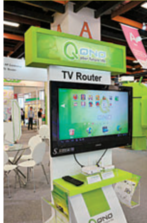
透過Android TV box用家不單可觀看電視，更可以下載Android Apps瀏覽YouTube，觀賞影片甚至玩遊戲同樣沒有問題。

今屆台北國際電腦展有不少展出Android相關應用與雲端服務的攤檔，可見產業的與時並進。以Android作業系統為例，除於智能電話上使用外，Android也可以在其他範疇上使用，如可以放在電視或者汽車之內，使不同裝置變得更「智能」。而雲端應用方面，場內有攤檔展示出透過伺服器進行所有運算，然後透過網絡顯示於超低配置的客戶端電腦上，亦有廠商將影片資訊作出整合，放於同一版面上，用家點選連結即可瀏覽相關影片。