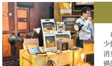
場中有不少展出周邊配件的攤檔，其中以此攤檔的皮革周邊配件最為吸引。

由於產業轉移，場內有不少攤檔展出不同類型的電子消費品周邊產品，最明顯不過的當然是智能電話的外置電池、手提電腦包、耳機等。不過場內最受矚目的周邊產品，可算是多支支援「Qi」（無線充電標準裝置）的裝置同時進行標準充電，以及Gigabyte為Ultrabook而設的Smart Lamp，此燈底座備有兩個USB插口、SD讀卡器、光碟機和3.5mm插口。