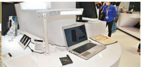
Smart Lamp連接至Ultrabook後就可以提升其周邊配置能力。