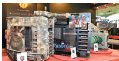
將機箱設計結合坦克車可以吸引不同類型的DIY組裝電腦家。

近年不少人當要添置電腦的時候都會考慮購買品牌桌上型電腦或手提電腦，組裝電腦市場的衰落是頗為明顯的現象。不過場內依然見到不少廠商展出組裝電腦的配件，由主機板、顯示卡、記憶體到機箱都有不少選擇，不過會場所見的選擇頗為兩極化，一方面是因應Intel新處理器Haswell而推出的一系列All-in-one電腦、手電電腦以及桌上型電腦，而另一方面則是以效能為主，為需要高運算能力的電玩用家而設計的組裝配件，加上為電玩競技優化有更高靈敏度的鍵盤和滑鼠，就可以讓玩家更得心應手。