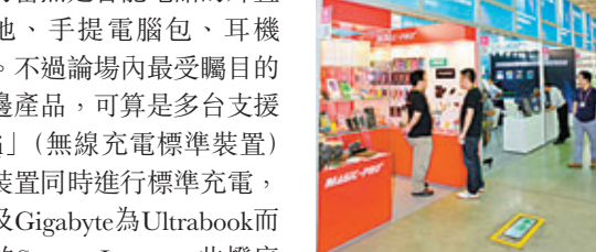
十數間香港中小企透過香港貿發局的支援，在台北國際電腦展香港館內參展。