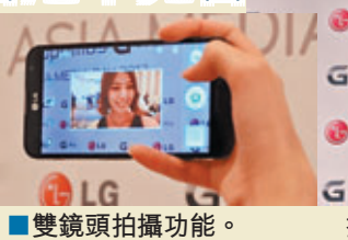
雙鏡頭拍攝功能。

LG電子於上月底假澳門舉行盛大亞洲區發佈會，推出全新旗艦級智能手機Optimus G Pro，配備5.5吋全高清IPS顯示屏，鎖定香港為亞洲首個據點，即將於本月優先發售，其後亦將分別於多個亞洲地區如台灣、新加坡、泰國、印度、印尼、菲律賓、越南及馬來西亞等陸續推出。以3.65毫米超幼邊技術和馬賽克背板設計帶來矚目外形的Optimus G Pro，配備Adreno 320 GPU及2GB記憶體，更採用Qualcomm Snapdragon 600 1.7GHz四核心處理器，配合4G LTE網絡支援，可以同時處理多種應用程式，加強多項工作處理外，亦能快速提供高品質多媒體享受，讓大家暢通無阻地欣賞影片、瀏覽網上資訊及享受打機的樂趣。