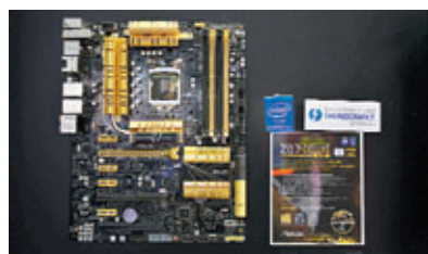
會場內不少廠商均於當眼位置展出支援最新Intel處理器Haswell的主機板。