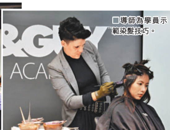
■導師為學員示範染髮技巧。