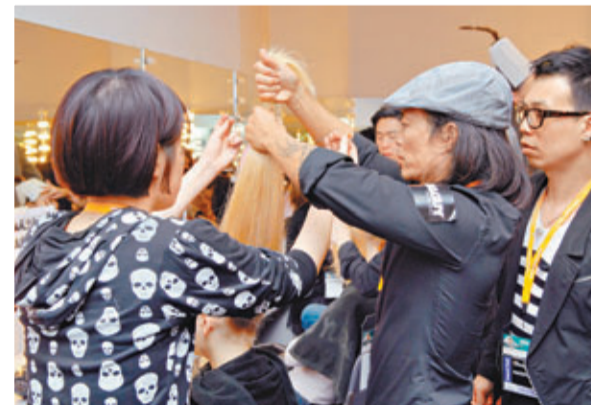
■髮型師不只在髮廊出現，同時會參與演唱會、時裝展等外景工作。

將來這類髮型師或可以延伸至婚禮統籌之中，因新娘子的髮型設計由拍婚照到婚宴當中亦可以有不同變化。葉燕茜指，雖髮廊未有參與這類工作，但未來或可成為一個趨勢。