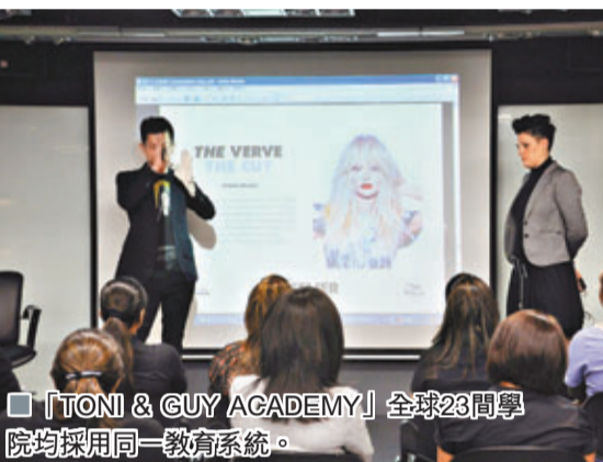
「TONI & GUY ACADEMY」全球23間學院均採用同一教育系統。