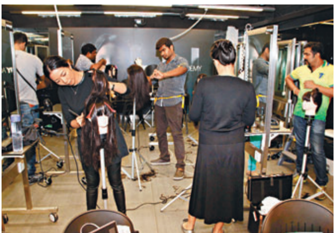
學院亦有短期進修課程予海外髮型師報讀。

另外，學院亦有開設其他短期課程予在職的髮型師進修，增值自我，當中亦不乏海外人士組團來港報讀。採訪當日，不乏印巴籍的學生在練習，葉燕茜指他們都是已在當地執業的髮型師，早前組團到港報讀學院的短期課程。