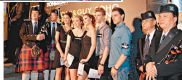
■「TONI & GUY」髮廊亦有接洽不同類型的工作。