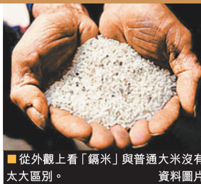
從外觀上看「鎘米」與普通大米沒有太大區別。

5月中旬，廣州市的食品藥品監督管理局（食藥監局）公布食米及相關製品的抽驗結果，發現有近半數樣本的重金屬鎘含量超標；所以，不少當地及鄰近的居民趁來港自由時購買袋裝食米。近日，隨着越來越多內地旅客來港買米，有人推測可能演變成繼「搶奶粉」後的「搶米潮」。