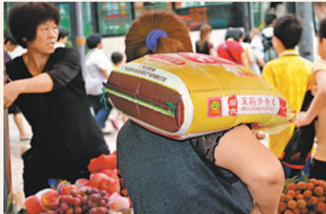
毒大米不斷出現，令家庭主婦在選米上大傷腦筋。圖為一位廣州主婦肩扛着剛從市場上買回來的大米。 資料圖片

從上表數字見到，近5年港人的耗米量的變化不大，人均年消耗量大抵維持在43公斤到48公斤之間，其間有升有跌，波幅不大，只是在2012年再跌到43公斤，是近年的新低。雖然單看5年的數據未能反映其中的變化，但當找來更長時期跨度的數字作比較，就看到極大的轉變。在網上找到政府統計處所公布的一份相關資料，在2006年，港人平均每月消耗食米3.8公斤，相較1963年的9.2公斤，43年之間，下跌了有六成之多。由此可見，食米對港人日常生活的重要性日漸下降。