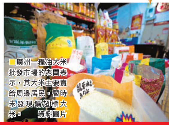
廣州一糧油大米批發市場的老闆表示，其大米主要賣給周邊居民，暫時未發現鎘超標大米。 資料圖片

結語 由是觀之，因本港實施開放經濟自由貿易，只要具備經濟條件，由於進口來源不少，要保證穩定的食米供應的問題應不大。另外，食米對港人的重要性也日漸下降，就算出現最極端的情況——「無米炊」，亦對本港居民的生活質素影響有限。