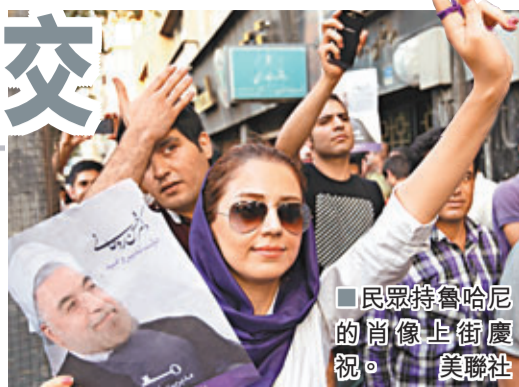
民眾特魯哈尼的肖像上街慶祝。

不過以色列對大選結果反應冷淡，有官員質疑，溫和派勝出只令伊朗更容易為核計劃爭取時間，外交部稱哈梅內伊才是制訂伊朗核政策的決策者。總理內塔尼亞胡要求國際社會繼續就核問題向伊朗施壓。由什葉派主導的伊朗支持敘利亞政府對抗多屬遜尼派的敘反對派，中東國家對選