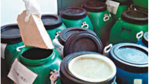
警方繳獲包裝成桶裝塗料的新型毒品「浴鹽」。