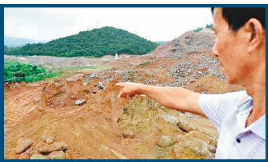
昨日下午,考古工作人員指着被破壞的古墓群發掘區。