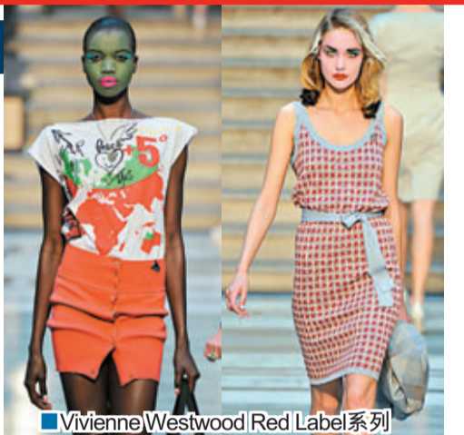
■ Vivienne Westwood Red Label系列

Vivienne Westwood今個夏天的Red Label系列以「氣候革命」為題，靈感來自英國皇家花園。在用色方面參考了都鐸式庭園，以土地、沙泥及濃厚的灰紅磚來填滿那些灌木叢間的冷灰、翠綠及蔚藍色空間，當中小格子及優質羊毛提供了夏日裙子以外的型格選擇，而紅白格子的針織衣服就最適合出席即興的野餐。在酒會及晚宴方面，用色則以淡色及冷色為主——把富印象派味道的荷塘圖案印於纖細柔滑的Jersey布料之上，再飾上銀色繡花細節提供輕盈版的選擇。