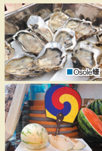
■ Osole蠔 ■ 翡翠蜜瓜，首度在港登場，產於釜山南部。

由韓國農水產食品流通公社主辦，全港最大型的韓國美食嘉年華K-Food韓食大派對，將於6月20至22日於尖沙咀文化中心露天廣場舉行。首屆K-Food韓食大派對，集合美食、音樂舞蹈表演及嘉年華，場內共有17個韓國美食攤位，展示韓國最人气的食品及當造農產品，並有即場免費試食及禮品贈送，尤其是新引入的韓國養殖生蠔Osole不能錯過，在一連三日裡，將會每日送出1000隻Osole蠔，讓入場人士有機會試食，Osole蠔每隻如手掌般大，肉質脆而富有口感。