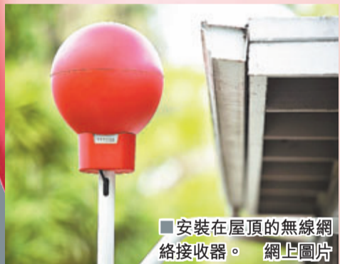
安裝在屋頂的無線網絡接收器。

互聯網近年發展迅速，但據估計全球仍有近48億人無法上網，是22億互聯網用戶的兩倍以上。Google旗下神秘實驗室「Google X」花18個月經營的「Project Loon」，計劃把太陽能推動的特製氣球放到不影響空中交通、20公里高的平流層，建構巨型空中通訊網絡。每個氣球可為1,250平方公里的範圍提供無線網絡訊號，約等同香港面積。