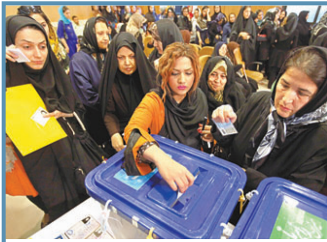
伊朗民眾踴躍投票。