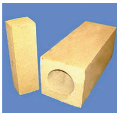
■砂磚是指至少含有90%二氧化矽的耐火磚等相關產品。