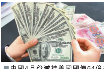
■中國4月份減持美國國債54億美元。