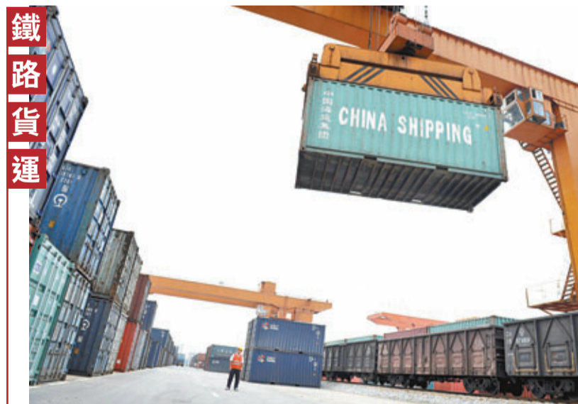
中國鐵路貨運組織改革15日起正式拉開帷幕, 這是中國鐵路總公司成立3個月來實施的第一項重大市場化改革, 標誌著鐵路貨運將全面走向市場。