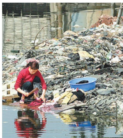
廣東省汕頭市貴嶼鎮水資源雖然豐富, 但所見渠道河流卻垃圾遍佈, 污水橫流。