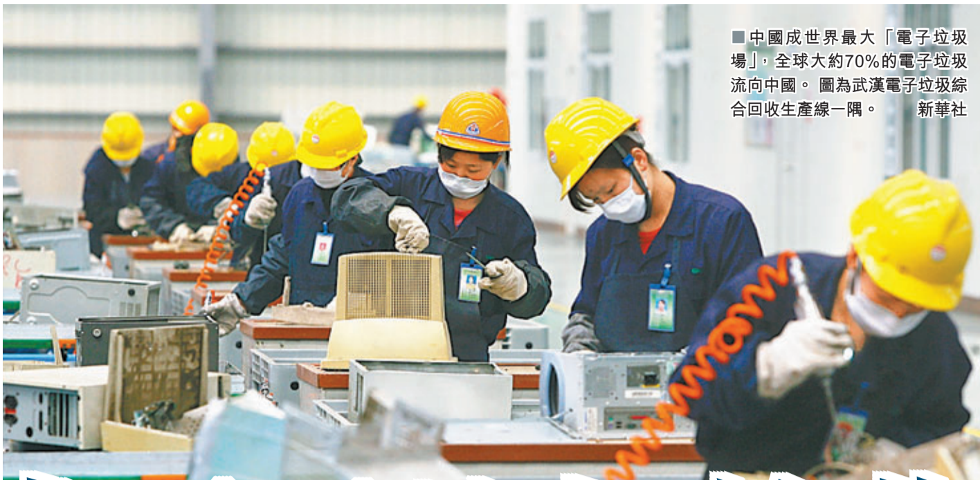
中國成世界最大「電子垃圾場」, 全球大約70%的電子垃圾流向中國。圖為武漢電子垃圾綜合回收生產線一隅。

香港文匯報訊(記者 海巖 綜合報導) 聯合國近日的一份報告指出, 中國成世界最大「電子垃圾場」, 全球大約70%的電子垃圾流向中國。雖然中國明令禁止進口電子廢棄物, 但在高達100%的驚人利潤驅使下, 來自世界各地的電子垃圾仍通過走私進入內地, 在東南沿海的一些地方, 非法拆解電子垃圾已發展成一條龍的完整產業鏈, 被當地奉為致富門路, 土壤、河流、空氣等卻因此受到嚴重污染。