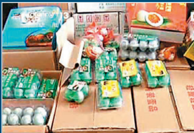
江西省南昌縣年工業用硫酸銅皮蛋銷往其他省市。