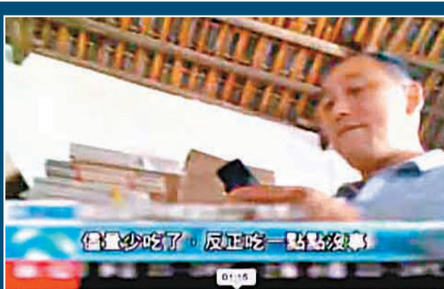
老闆稱，「反正吃一點點沒事，如果真正有事的話大家也不能生產了。」視頻截圖