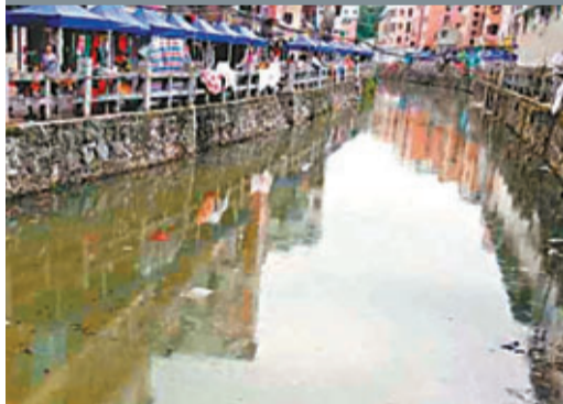
廣州市荔灣區驅馬涌垃圾漂浮。本報廣州傳

指其中39條屬於「劣五類」，佔公佈數量近80%，其中包括廣州亞運會期間耗資10億元(人民幣，下同)治理的樣板工程東濠涌。