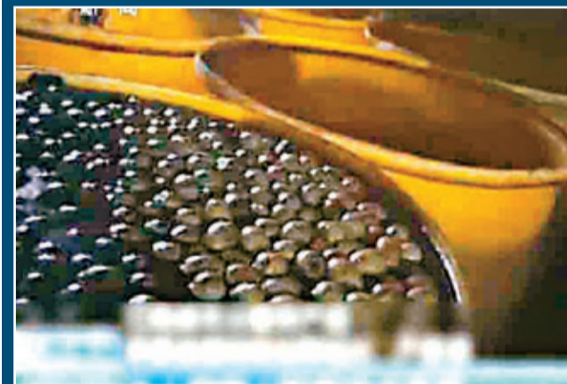
工人稱，醃製的皮蛋不用兩個月就能出售。視頻截圖