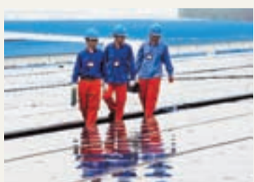
浙江省內最大企業屋頂光伏發電項目即將建成併網。新華社