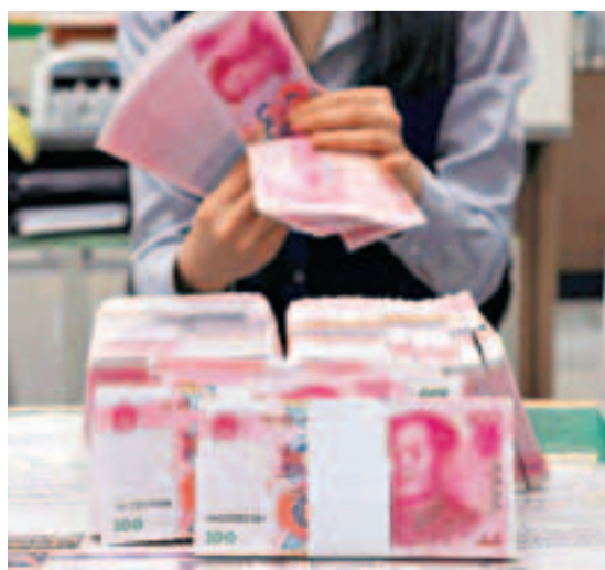
金管局昨公布，自去年6月延長本港人民幣即時支付結算系統運作時間後，平均每日交易金額已在今5月大增至3,900億元。資料圖片

另外，工銀亞洲昨宣布發行5億人民幣1年期淨息存款證，票息以香港銀行同業離岸人民幣拆息(CNH HIBOR)加35基點定價。工銀亞洲為本次存款證發行的承銷商和賬簿管理人。