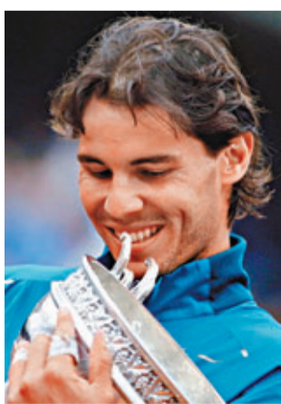
拿度復出後勇不可擋。

拿度將參加巴黎ATP世界巡迴賽總決賽，他11月回到O2體育場時將努力把總決賽冠軍收入囊中。27歲的西班牙選手成為首個因為第八次奪得法網冠軍而獲得年末總決賽的單打選手。