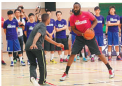
NBA球星夏頓昨天向香港青少年球員傳授技術。

今年NBA季後賽總決賽是熱火和馬刺的舞台，只能作壁上觀的夏頓認為，兩支球隊的實力旗鼓相當，因此「大鬍子」昨日亦未敢寫包單，指哪一隊的贏面較大。