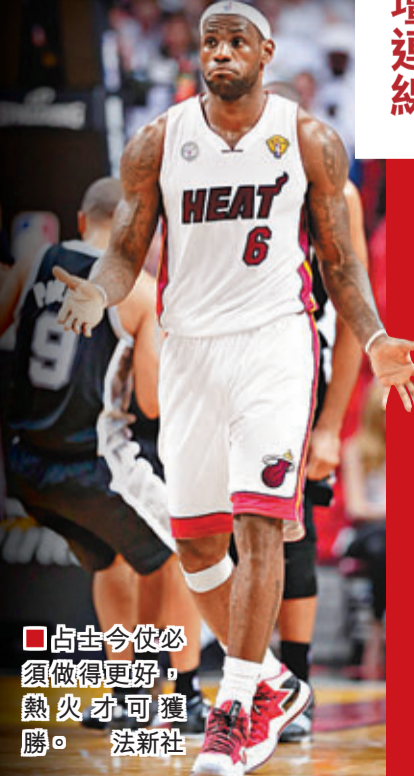
占士今仗必須做得更好，熱火才可獲勝。