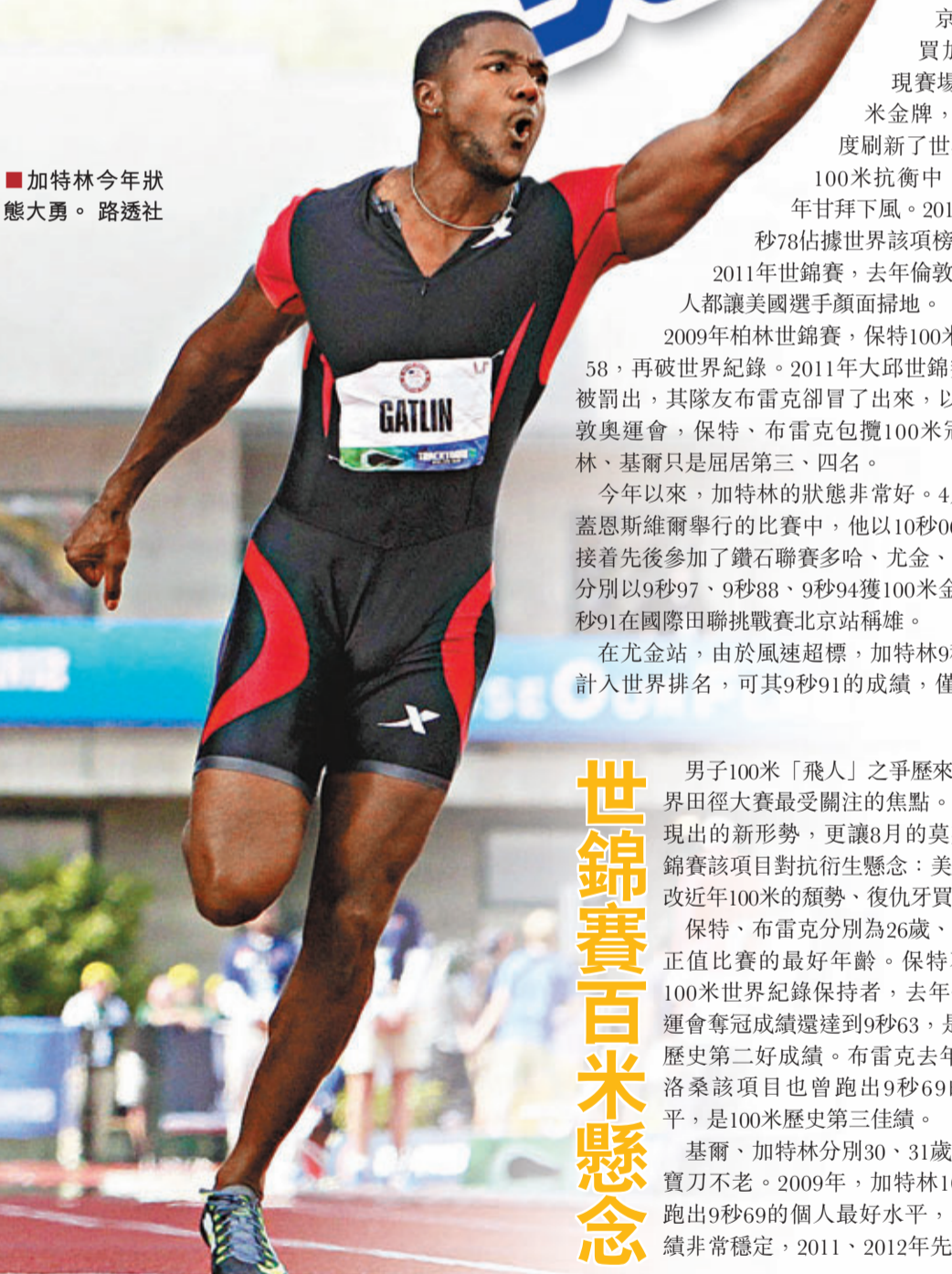
加特林今年狀態大勇。

2008年北京奧運會，「牙買加閃電」保特驚現賽場，不僅奪得100米金牌，還以9秒69大幅度刷新了世界紀錄。之後在100米抗衡中，美國人幾乎年年甘拜下風。2010年，基爾曾以9秒78佔據世界該項榜首，可2009年、2011年世錦賽、去年倫敦奧運會，牙買加人都讓美國選手顏面掃地。