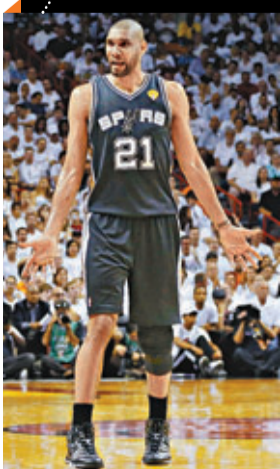
馬刺老將鄧肯再領球隊攻勢。

NBA總決賽第三場比賽今天上午9時進行，馬刺回到主場迎戰熱火。雙方在前兩戰打成1:1平局，第三戰勝利的歸屬就變得尤為重要。據統計，自1985年總決賽實行2-3-2賽制以來，有13組對決的前兩場打成1:1，其中12支拿到第三戰勝利的球隊都奪得了最後的總冠軍，概率高達92.3%。