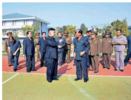
朝鮮領導人金正恩視察平壤足球學校。