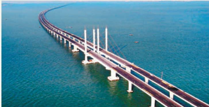
■山東高速膠州灣大橋頒發喬治·理查德森獎。

香港文匯報訊 據《人民日報》報道，山東高速集團10日證實，日前在美國舉行的第30屆國際橋樑大會(IBC)向山東高速膠州灣大橋頒發喬治·理查德森獎，這是迄今為止中國橋樑工程獲得的最高國際獎項。全長36.48公里的膠州灣大橋是目前