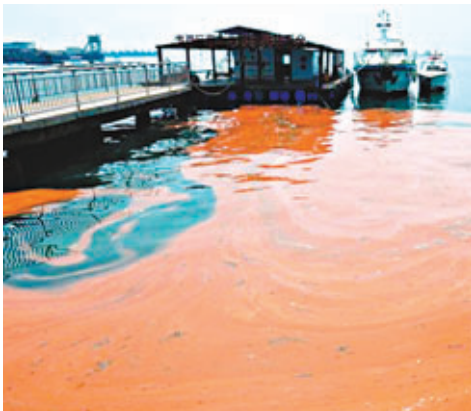
■浙江省樂清灣由於重大污染頻發，曾經的海洋牧場變身海洋垃圾場。

廣東省交通集團預計，端午小長假期間，高速公路出行高峰將在假期3天都基本高位運行，返程高峰將在12日下午出現。