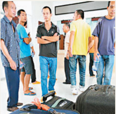
■在加納採金的工人準備回國。

經中國駐加納使館與加納國家安全和移民部門負責人密切協調，8日，124名被羈押在加移民總局拘留所的中國採金人員獲釋。10日，加納方面又釋放了羈押在該國國家調查局監獄的45名中國採金人員。