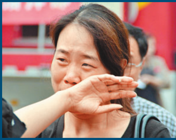
■獲悉親人仍埋於塌樓下，一位婦女在痛哭。