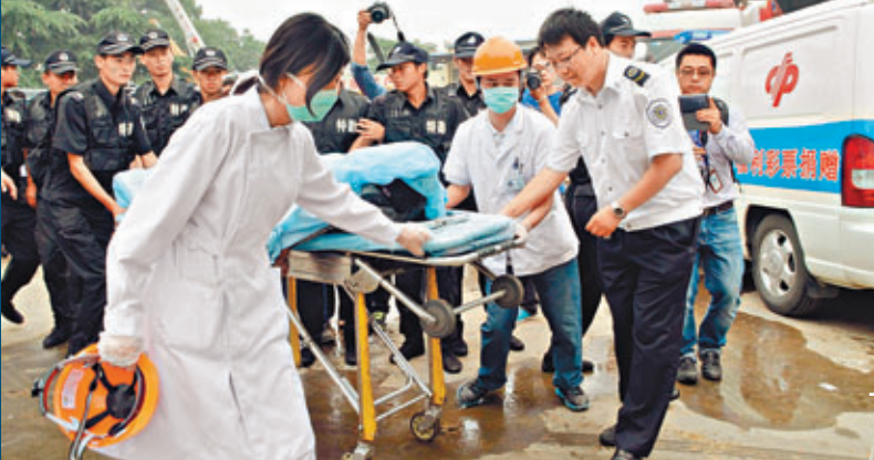
■昨日，江蘇蘇州燃氣集團橫山儲罐場生活區綜合辦公樓一樓職工食堂廚房發生爆炸致大樓倒塌，造成11人死亡。圖為消防員搶救出一名被埋人員。