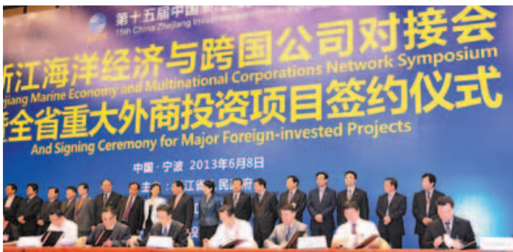
全省重大外商投資項目簽約儀式現場。

寧波團有7個項目參加浙江省級項目簽約儀式,總投資64.8億美元,協議外資15.6億美元,較上屆同比分別增長40%、177.1%和477.8%。項目涉及旅遊開發、港口合作、空港合作、空港物流、產業投資及安防產品製造等產業,投資國家及地區有美國、丹麥、法國、新加坡及香