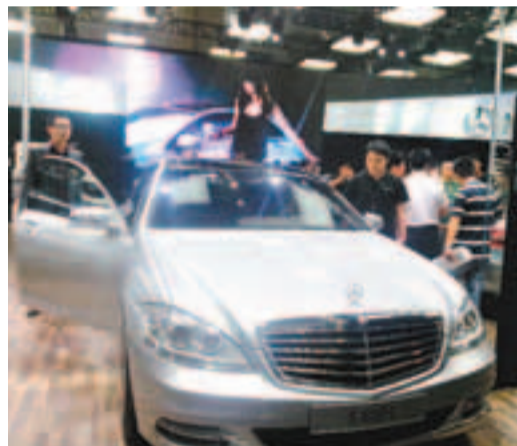
奔馳推出一款汽車優惠20萬元,吸引大量顧客購買。

香港文匯報訊(記者 李昌鴻 深圳報導)深港國際汽車博覽會6月8日至13日在深圳舉行,眾多外資品牌紛紛推優惠爭奪珠三角市場。蘭博基尼、奔馳、寶馬、奧迪等高級汽車紛紛加大市場優惠幅度,其中奔馳和寶馬一款高級車均給予顧客20萬元(人民幣,下同)優惠。而一氣紅旗推出的國產高級車H7,最高售價為47.98萬元,加入爭奪被外資壟斷的中國高級車市場。