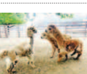
換了新造型的弟弟(左)被姐姐一番打量。

香港文匯報訊 (記者李欣 天津報道) 為了讓羊駝健康舒適地度過炎炎夏日，日前天津動物園特別請來知名的寵物形象設計師，為園內的三隻羊駝打造「時尚」避暑造型。結果，換了新造型的羊駝弟弟，卻遭到姐姐的唾棄。