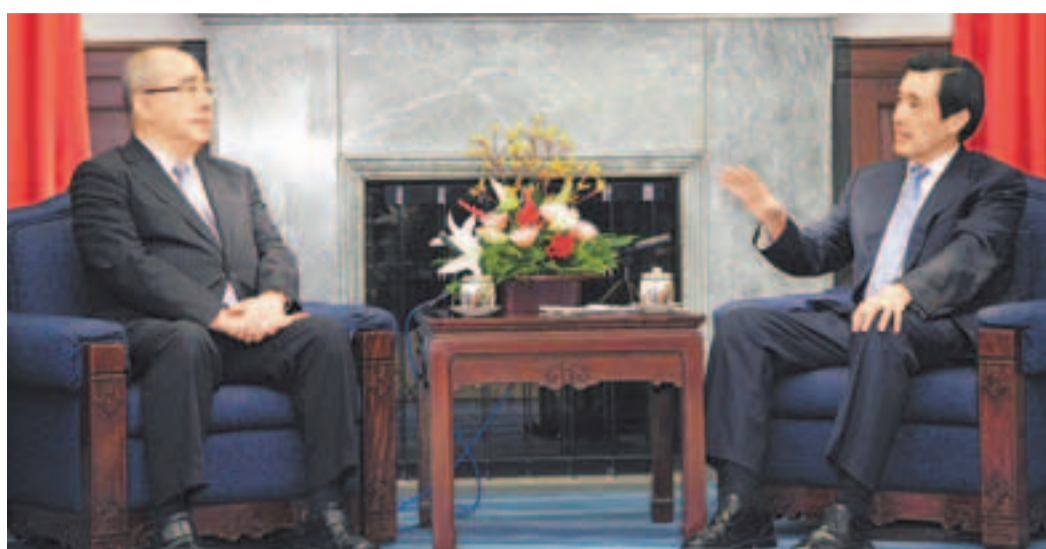
「習吳會」即將登場，馬英九(右)昨日晤吳伯雄(左)，作行前會面。

香港文匯報訊 據中新社報道，中國國民黨榮譽主席吳伯雄12日至14日將率國民黨大陸訪問團訪問北京。馬英九昨日與吳伯雄行前會面時說，此訪一方面檢討5年多來兩岸關係發展，另一方面前瞻未來方向，意義非常重大。馬英九預祝吳伯雄任務成功，帶回來雙方關係往前邁進的好消息。談及兩岸互設辦事機構問題，馬英九特別說明，兩岸間不是「國與國」的關係，不會把雙方設立的辦事機構當做「外交使領館」。