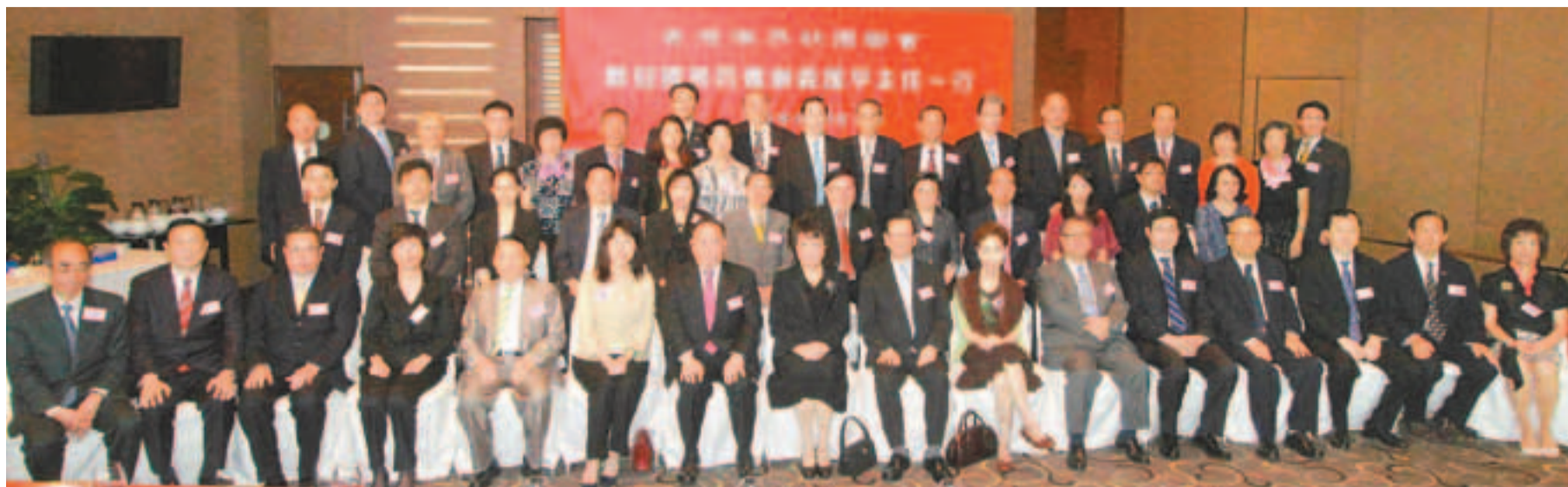
香港僑界社團聯會設宴歡迎國僑辦主任裘援平一行,該會會長余國春和同仁到訪貴賓合影。

旨,支持特區政府依法施政,在各方面取得了較好的成績。她感謝僑辦對該會的關心及支持,並提到該會「堅決反對『佔領中環』,因其將嚴重影響香港的經濟」。裘援平表示,僑總走過光榮的發展歷程,積極維護僑胞利益,支持特區政府依法施政,支持內地經濟建設。她說,粵港澳發展戰略已開始實施,相信香港定能與祖