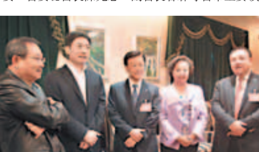
四川省副省長甘霖(左二)與華商聯高層合影。右起:吳兵、張國衛、許榮茂、莊紹經。