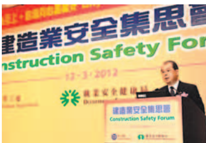
■勞工處及職安局經常聯手舉行宣傳活動。圖為勞工處局長張建宗出席建造業安全集思會。