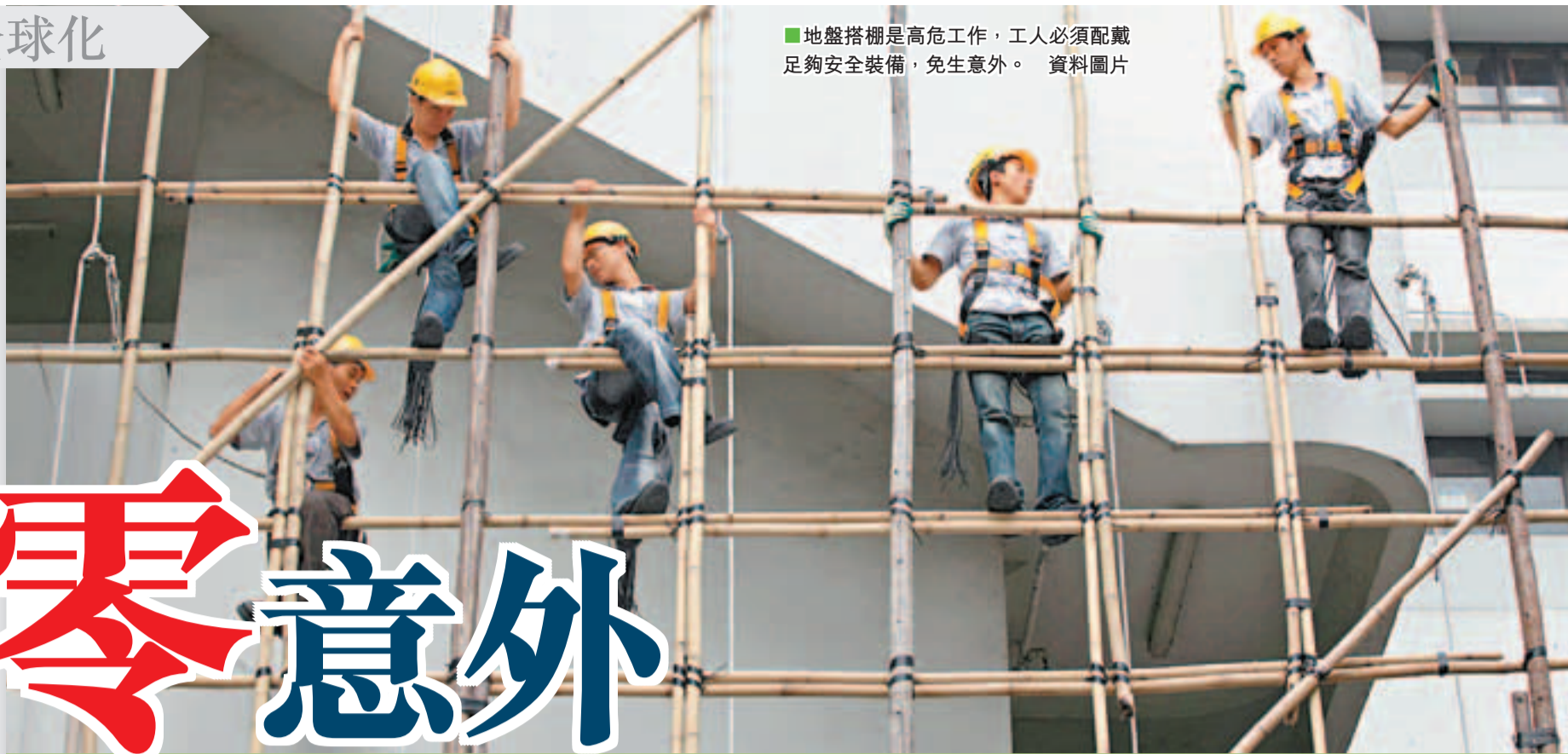
■地盤搭棚是高危工作，工人必須配戴足夠安全裝備，免生意外。 資料圖片

近年，本地整體建築工程量上升，港府特別呼籲企業履行社會責任，為建築工人提供安全工作環境和良好安全管理，宣揚建造業零意外訊息。到底何謂企業社會責任？有哪些國際機構和本地組織，以及條約促進改善職業安全問題？本文會為大家逐一探討。 ■丁天悅