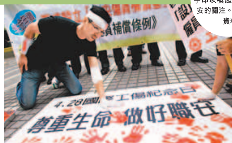
· 讓人可維持或強化本身的能力及資產； · 讓人有餘力協助改善其他人現在和將來的生計； · 在上述過程中不會削弱天然資源的基礎，不會破壞環境。 ■參考來源：樂施會

可持續生計 (Sustainable Livelihoods) ：一個以人為本的扶貧及發展概念，強調幫助貧窮者建立個人、家庭和社區網絡的能力，讓個人以至整個社區，也獲得可靠並持續的生計。金錢與物質的支持並非可持續生計的全部，要協助他人改善生活，我們必須先了解其發展需要，以及全面認識其生活處境，看清楚個人及社會發展的複雜性，進而協助他人發展潛力及獲得機會。可持續生計的基本條件包括： · 讓人有能力應付壓力和打擊，並有復元能力； · 讓人可維持或強化本身的能力及資產； · 讓人有餘力協助改善其他人現在和將來的生計； · 在上述過程中不會削弱天然資源的基礎，不會破壞環境。 ■參考來源：樂施會