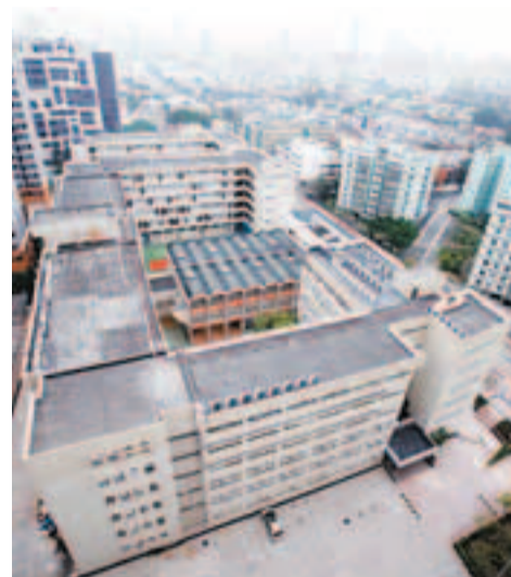
浸大表示,無論南面用地將來有何發展,發展北面部分時一併拆卸整棟建築物是合理做法。