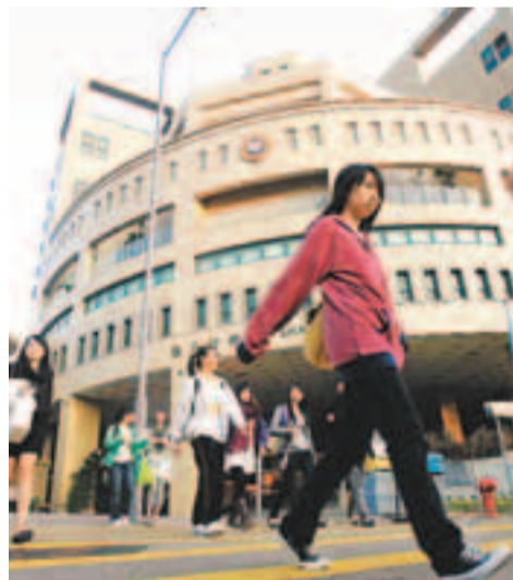
楊潤雄指,南面地皮用途未拍板前,浸大不應拆卸餘下的北部建築物。圖為浸會大學校園。

立法會議員兼浸大政治及國際關係學系副教授陳家洛指,政府上述建議是「想玩一拍兩散」。教育局副局長楊潤雄回應時強調,當局全無不良意圖,指浸大現可繼續就李惠利北部作規劃,因這亦需時2年至3年,局方仍會助浸大爭取撥款。