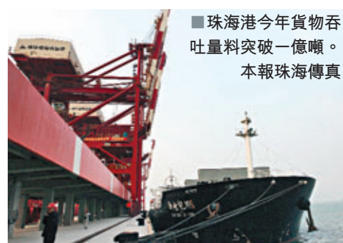
■珠海港今年貨物吞吐量突破一億噸。本報珠海傳真

香港文匯報訊(記者 李芳、張廣珍 珠海報道) 作為今年廣東省重點工程之一，珠海港高欄港區15萬噸級主航道工程近日進行環境影響評價第一次公示，計劃於今年年底完成施工招標，屆時準備開工。該工程投資近9億元(人民幣，下同)，工期為1.5年，建成後將使珠海港擁有廣東省「最重量級」主航道，15萬噸級船舶可全天候進出珠海高欄港區。