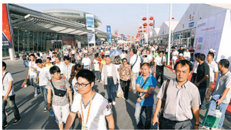
上屆中國—亞歐博覽會吸引大量市民參觀。資料圖片

為更加符合亞歐國家，特別是周邊國家的市場需求，本屆亞博會的展品大類調整四大類，設置分別為：國際及港澳台展區、商品貿易展區(專業展區)、投資合作展區(分為各地州市展區及各省市展區)、高新技術及服務貿易展區。同時，繼續設置室外展區，展區總面積為8.9萬平方米。