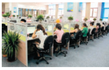
■蜀山區打造呼叫中心產業城項目，已吸引40多家企業落戶。圖為入駐企業工作間。

蜀山區呼叫中心產業城項目按照走節約集約、產城一體化發展之路的發展要求，目前園區公共配套已初步自成體系，實現企業「拎包入住」，生產、生活不出園區。下一步，產業城所在地蜀山新產業園(省級開發區)還計劃投入巨資，全面提升呼叫中心產業城的生態環境。