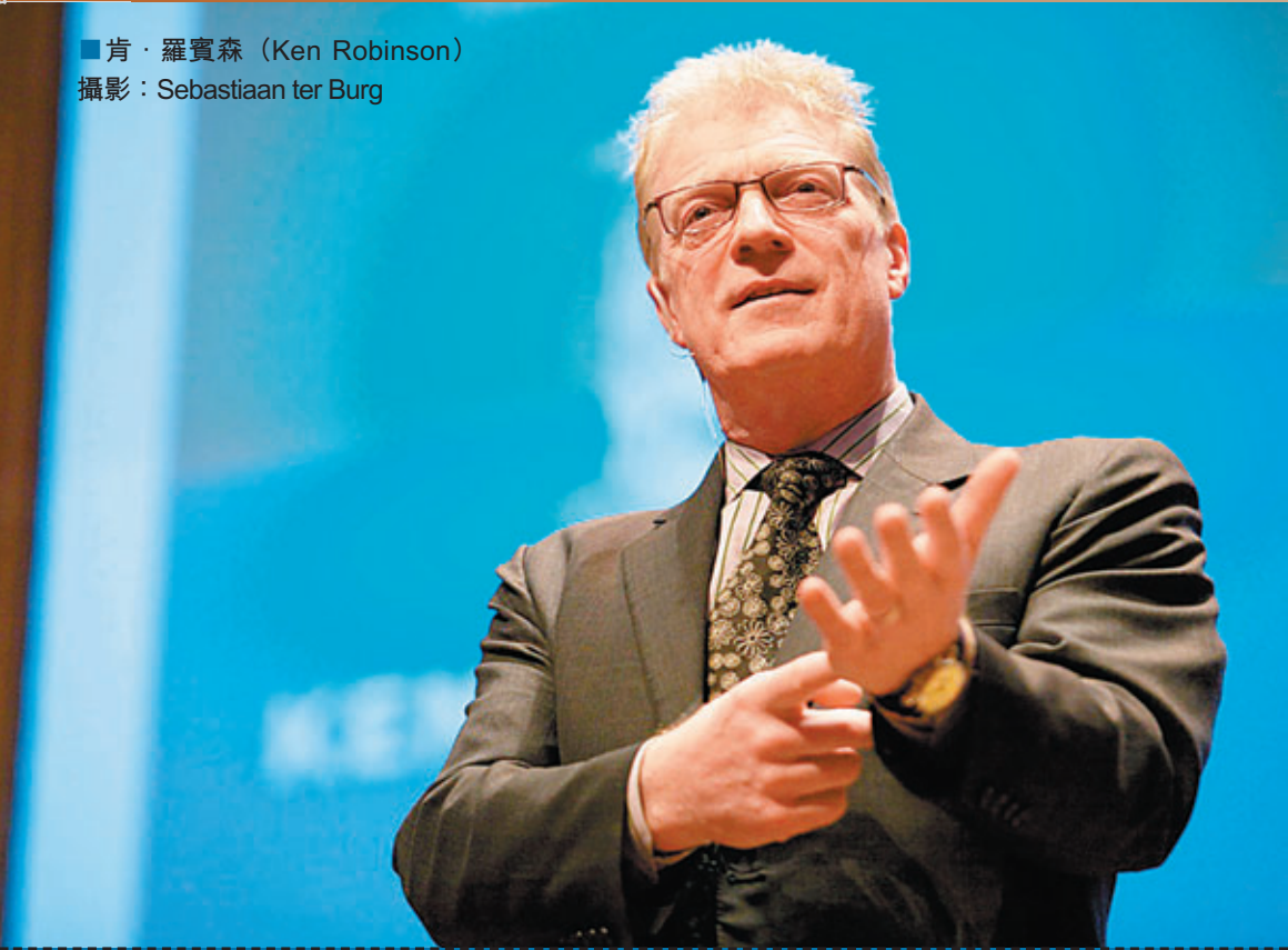
■肯·羅賓森（Ken Robinson）