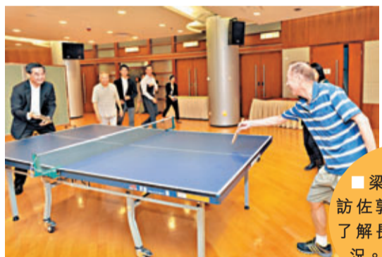
梁振英早前訪佐敦谷采頤居了解長者居住情況。資料圖片

人較為合宜，住3人至4人則較為擁擠。在公屋方面，對比2001/02年和2011/12年的新建公屋單位數字，總數明顯減少（見表二），小型單位（包括小單位及一房單位）的比例增加，而最令注目的是三房單位在2007/08年便開始停建了，這無疑是影響了三代同堂的居住機會。顯而易見，無論是新建公屋，抑或私樓，均不利擴展家庭。換言之，建屋政策本身已是長者獨居的罪魁禍首之一，而建屋政策又明顯非個人所能左右。