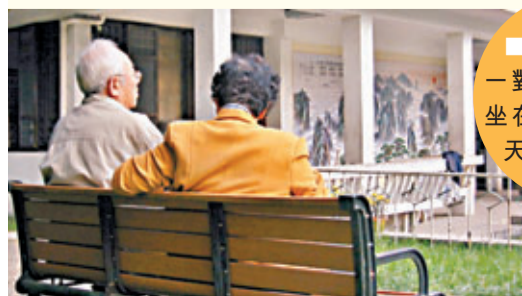
安徽合肥的一對老年夫婦正坐在公園休息聊天。

請即登入http://kansir.net/「Kan Sir 通識教室」瀏覽更多參考資料及學習教材。