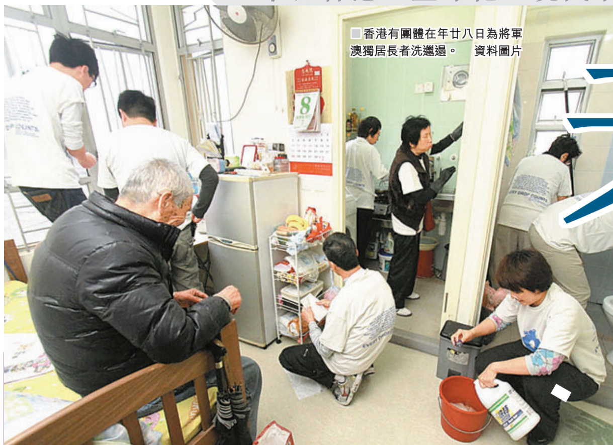
香港有團體在年廿八日為將軍澳獨居長者洗滌週。資料圖片