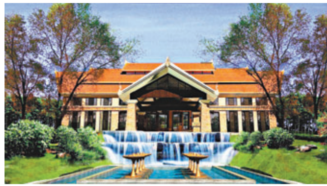
錦江國際酒店簽約入駐雲南石林。圖為該度假酒店內的別墅效果圖。

香港文匯報訊(記者 劉璇)錦江國際酒店管理公司與雲南佳益房地產公司在昆明錦江大酒店，簽訂「石林錦江國際度假酒店」全權委託管理合同，酒店計劃於2014年2月營業。該項目定位為一家五星級度假酒店，佔地面積5萬多平方米，建成後在主樓擁有118間設備完善的標準客房及套房，另外還有40幢寬敞的別墅分佈在酒店區域內。每個別墅都有3個房間，每間房裡有獨立浴室和客衛，公共區域有餐廳和起居室以及一個在二樓的工作區。