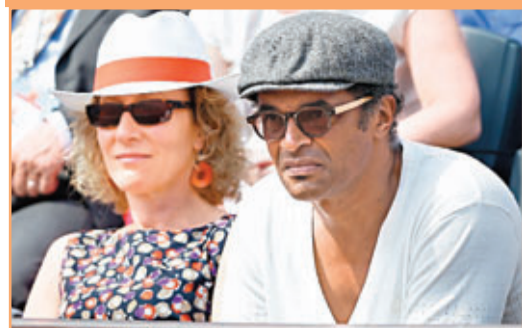
諾亞(右)看好宋加有力奪標。資料圖片