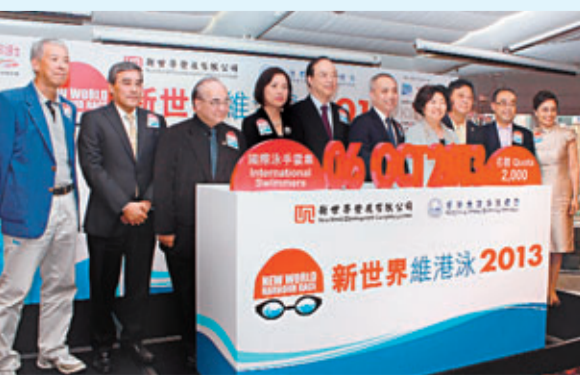
維港渡海泳10月舉行。

有興趣報名的市民可於7月27、28、30日及8月1日往東涌游泳池試水，時間和篩選詳情可瀏覽以下網址： www.hkasa.org.hk 。