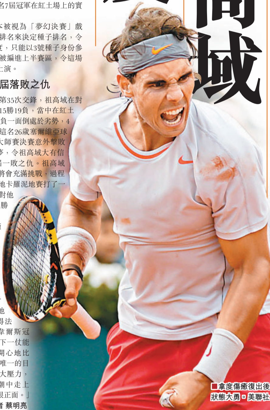
拿度傷癒復出後狀態大勇。