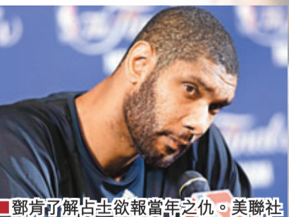
鄧肯了解占士欲報當年之仇。美聯社