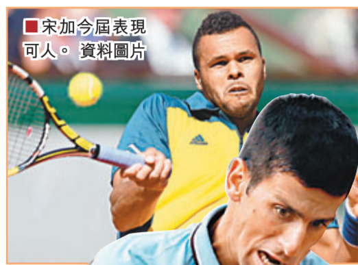
宋加今屆表現可人。

有「法國阿里」之稱的宋加，在今屆法網越戰越勇，以不失1盤強勢躋身準決賽，1983年法網男單冠軍、法國名宿諾亞就力挺這位「後輩」，可成為30年來首名在家鄉揚威的法國球手。