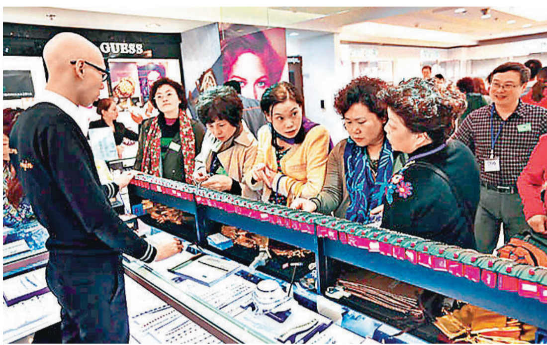
■赴台個人遊試點將大幅新增十市，台當局並決定8月1日起發給高端陸客赴台多次簽注。目標創造超過190億港元觀光消費。圖為赴台消費陸客。資料圖片

在爭取大陸客赴台個人遊方面，台當局將鎖定高端消費人士、教育和文化高端專業人士，發給多次入境許可證，移民部門已就此展開修法工作。行政機構「政務委員」楊秋興昨日邀集內務部等相關部門，研商簡化大陸專業人士、商務人士赴台簽注。