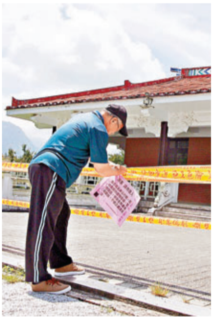
有40餘年歷史的日月潭慈恩塔及「蔣公行館暨王太太夫人紀念堂」(上圖)兩棟建築物，在602地震中震損，原定7月的活化開放計劃生變。左圖為當局昨日在慈恩塔拉起封鎖線。