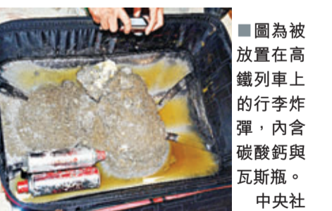
■圖為被放置在高鐵列車上的行李炸彈，內含碳酸鈣與瓦斯瓶。