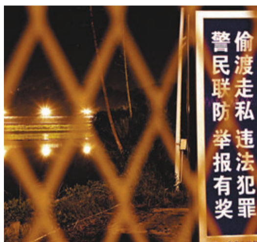
香港新邊境防護網的強光，在深夜也能清晰看到。

勞工及福利局發言人指出，在2013年6月10日及其後，社署會在下周一起向未持有有效的牌照或豁免證明書卻繼續經營的院舍採取適當的執法行動，包括向院舍營辦人及/或主管提出檢控，經法庭定罪後可判處罰款10萬元及監禁2年，並可就罪行持續的每1天，逐日罰款1萬元。