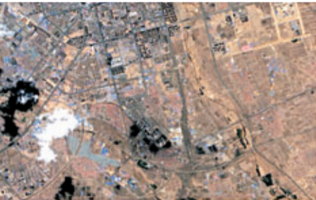
「高分一號」衛星成像獲取的大同市影像圖。

國防科工局稱，「高分一號」衛星工程影像圖正式發佈，表明該工程測試第一階段工作結束，天地系統間協調匹配，衛星各系統工作正常，達到設計要求，將實現為國土、環境、農業等領域提供精準服務的目標。「高分一號」任務後續還將開展地面系統定標、幾何精校正