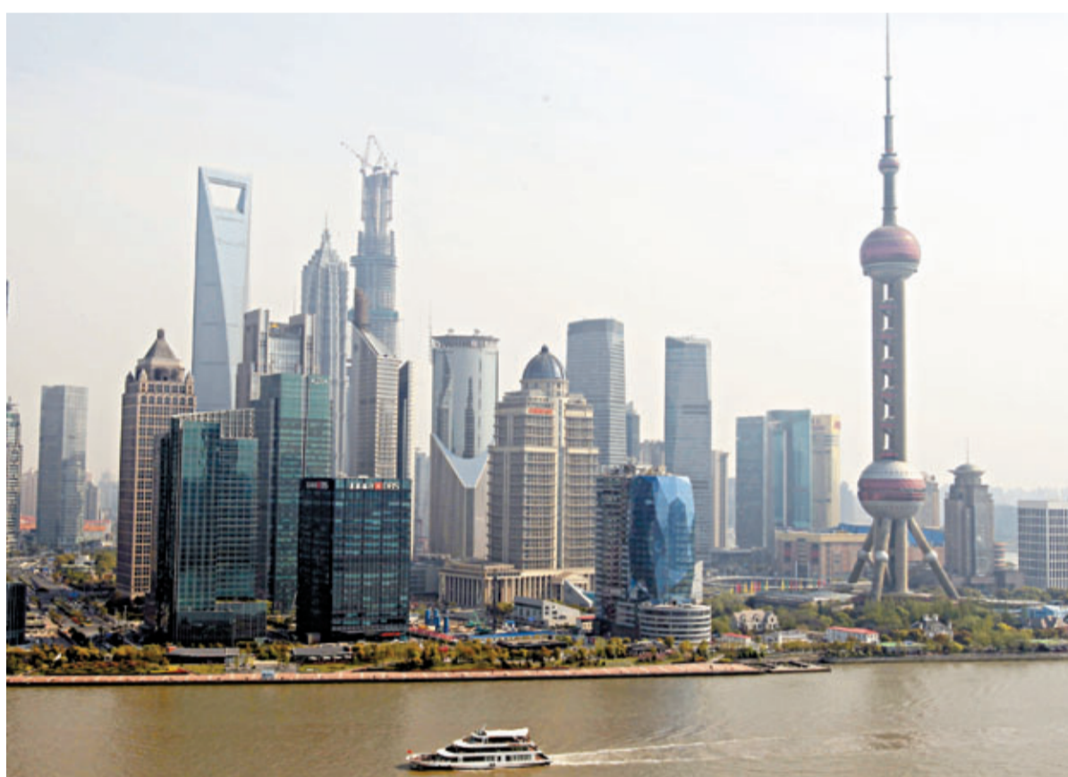
浦東自由貿易區若獲批設立，對上海貿易中心、航運中心、金融中心三方面的功能都會有所提升。

據上海自由貿易區課稅組權威專家介紹，自貿區以貿易自由為核心特徵，在關稅及非關稅壁壘(資金、外匯管制等)方面給予企業各類特殊優惠政策。進駐自貿區的企業，將享有更便捷的審批流程和稅費減免政策。再加上人民幣資本項目下逐步開放，上海自由貿易區將全方位為企業提供與海外資本和市場對接的窗口。