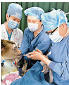
藏酋猴術後存活10天破世界紀錄。

香港文匯報訊(記者 熊曉芳 西安報導)第四軍醫大學西京醫院6日舉行新聞發佈會宣佈，截至6日14時，該院肝膽脾外科施行的轉基因豬—藏酋猴異種異位脾窩輔助性肝部分移植實驗手術，創下轉基因豬異種肝移植實驗動物術後存活10天的最新醫學紀錄，一舉打破此前高難度移植手術動物術後存活9天的世界紀錄。該手術使異種器官移植走向臨床應用邁出了極為重要的一步，有望解決大器官移植中器官來源短缺問題。